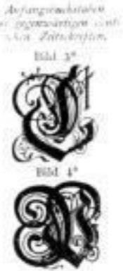
(7. Soennecken's H o von 1904)

Köln. Ztg. „Wir glauben nicht zu irren, wenn wir dieses vortreffliche Buch an die Spitze aller Werke stellen, welche sich über die geschichtliche Entwicklung der lateinischen und deutschen Druck- und Schreibschriften verbreiten.“