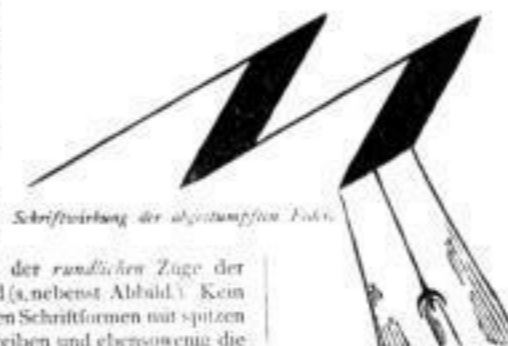
Schriftführung der abgestumpften Feder.

Die technische Druck- und Schreibschrift