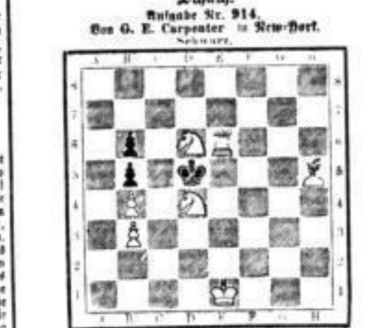
Wichtig sieht es aus und legt in drei Zügen matt. (7 + 3 = 10.)