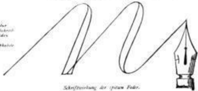
Schriftführung der späten Feder.

Die technische Druck- und Schreibschrift