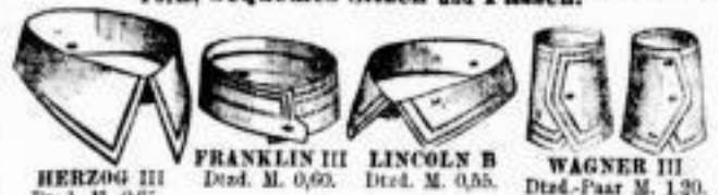
HERZOG III Dred. M. 0.85, FRANKLIN III Dred. M. 0.90, LINCOLN B Dred. M. 0.85, WAGNER III Dred.-Paar M. 1.20. Jeder Kragen kann eine Woche lang getragen werden

Mey's Stoffkragen sind keine Papierkragen, denn sie sind mit wirklichem Webstoff vollständig überzogen, haben also genau das Aussehen von Leinwandkragen; sie erfüllen alle Anforderungen an Haltbarkeit, Billigkeit, Eleganz der Form, bequemes Sitzen und Passen.