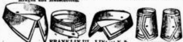
HERZOG III Dtd. M. 0,85. FRANKLIN III Dtd. M. 0,80. LINCOLN B Dtd. M. 0,50. WAGNER III Dtd.-Paar M. 1,20.

Mey's Stoffkragen und Manschetten sind mit Webstoff vollständig überzogen und infolgedessen von Leinwandwäsche nicht zu unterscheiden. Mey's Stoffkragen und Manschetten werden nach dem Gebrauch einfach weggeworfen; man trägt deshalb immer neue, tadelloser passende Kragen und Manschetten.