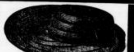
Form für Furchhüte.