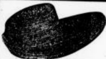
Form für Washhüte.