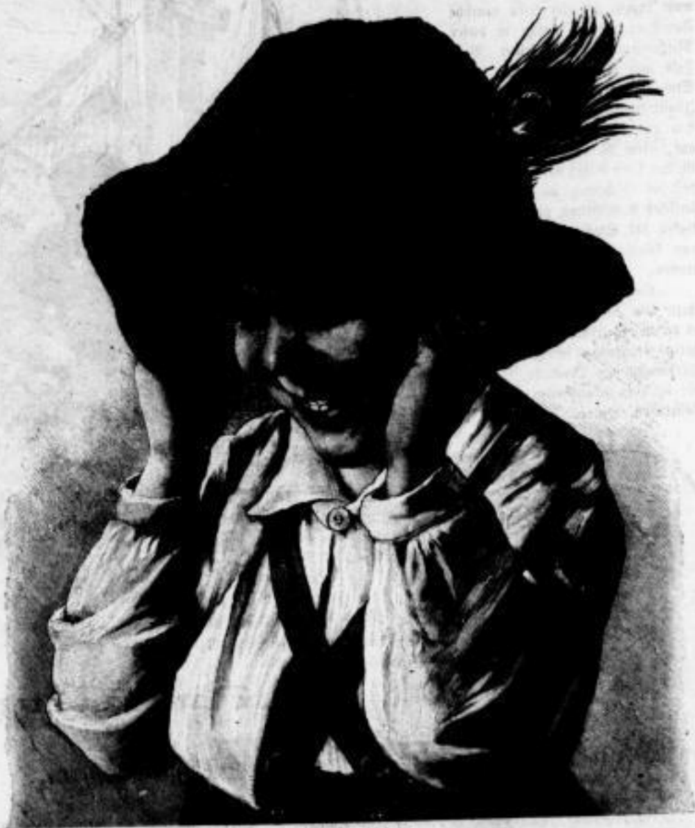
Illustration von Dörck

vegrenzende, umfangreiche Novelle von H. Vog: Der Mönch von Berchtesgaden. Eine geistvolle, feinkam- ristische Novelle von Karl Heder: Per Procura. Eine farbenbunte, fesselnde, italienisch-deutsche Reisenovelle von R. G. Edler: Der Mond von Cortina. Einen