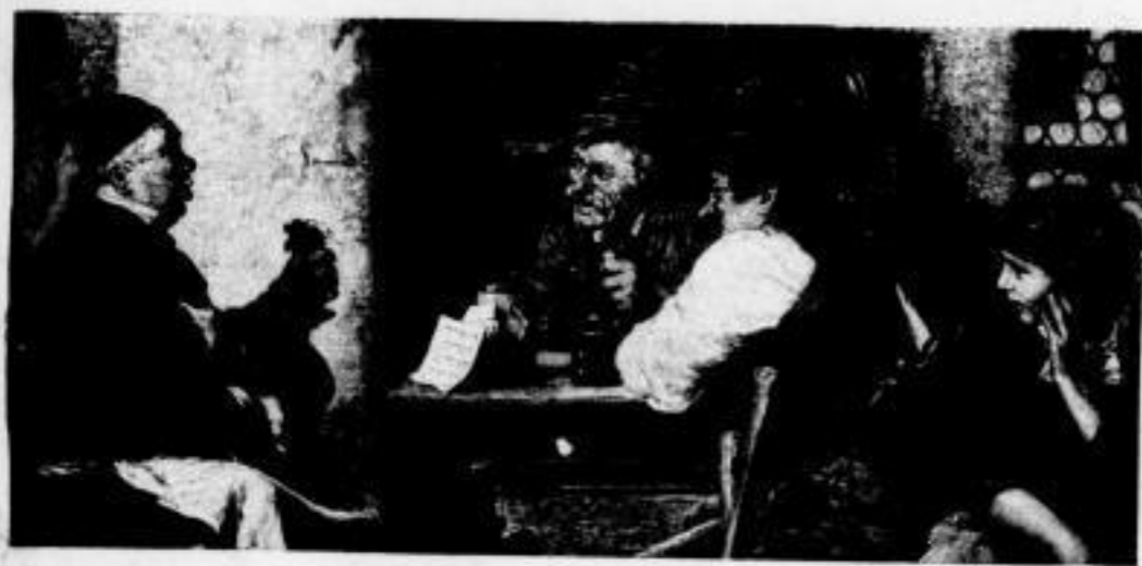
Der wöchentliche Wirt. Von G. Kaufmann.