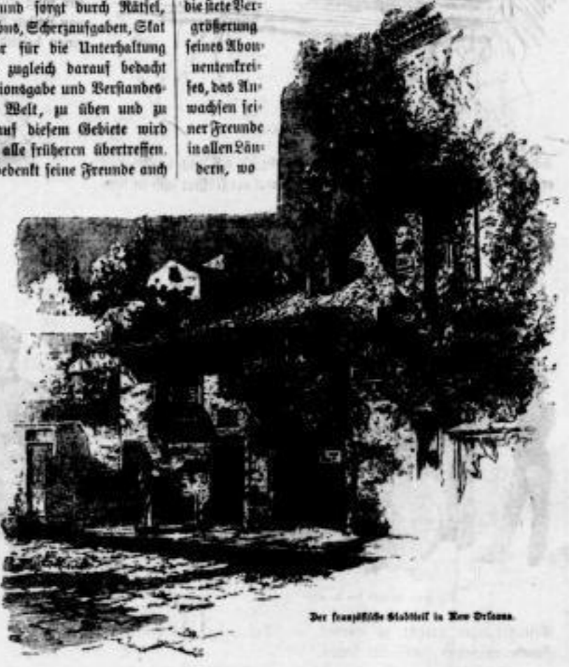
Der französische Städtel in New Orleans.

„Vom Fels zum Meer“ bedankt seine Freunde auch in diesem Jahre mit Extra-überraschungen mannigfacher Art, welche andeuten jedoch, um den Lesern die Freude des Unerwarteten nicht abzuschwächen, es einstweilen noch sich vorbehält. In der Weltpost wird „Vom Fels zum Meer“ wie bisher, ein Postamt sein, das einen riesigen Briefkasten aufstellt, der die weiseste Kunst erteilt, so daß es ein Vergnügen sein wird, Briefe dort hineinzuworfen und eine so schöne Antwort zu erhalten. Im Ernst und Scherz wird dieser „Sprechsaal“ die Interessen der Anfragenden vertreten und hierbei behält „Vom Fels zum Meer“ trotzdem seinen außerordentlich billigen Preis von 1 Mark für das Heft bei, wird aber in