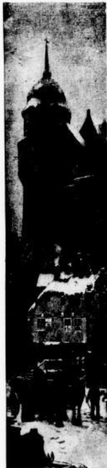
Das Mischen. Von H. Köster.

einander schneiden und Zusammenlegen. Dann haben neben dem Graphologischen, den Handschriftenbeutungen, die Physiognomischen Briefe des Professor Zsendek großes Aufsehen erregt und die lebhafteste Teilnahme in allen Leserkreisen gefunden und verleihen diesem Jahrgang einen sehr wesentlichen Reiz. Die folgenden Hefte werden sehr interessante Köpfe, von dem scharfsinnigen Gelehrten analysiert, vorführen. Im Laufe des Jahrganges werden ferner noch mancherlei interessante Beigaben den Leser erfreuen und überraschen. In dieser Richtung nimmt „Vom Fels zum Meer“ eine eigenartige Stellung in der deutschen Zeitschriftliteratur ein und hat sich einen Ruf erworben, der ihm einen mächtigen Leserkreis und treue Anhänger verschaffte.