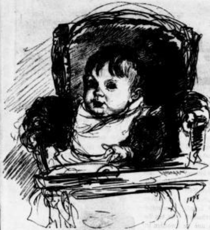
Amberstahl. Von G. Knyffner.

wertvoll ist, so fürs erste die Reproduktion eines vortrefflichen Gemäldes: