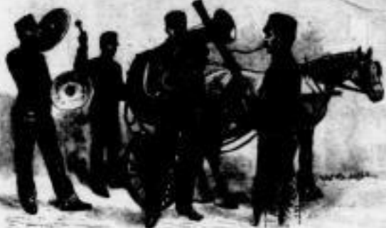
Das große Glück der Apollin.

gebracht, als zu Anfang seiner mit so glänzendem Erfolge begonnenen Laufbahn. Auch künftighin wird „Vom Fels zum Meer“