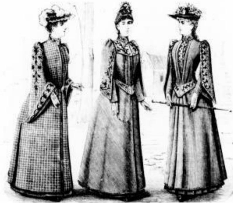
Raoul. Regenmantel nicht gestickt // 37 u. 47. Venus. Regenmantel nicht gestickt // 35 u. 42. Mignon. Regenmantel nicht gestickt // 41, 48 u. 52.