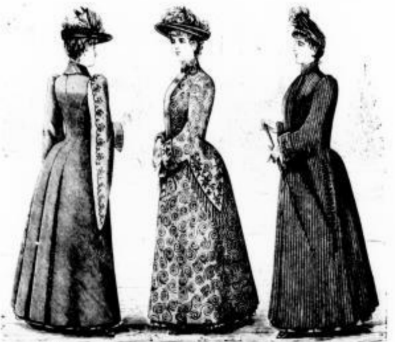
Niobe. Promenaden-Mantel // 33, 37 u. 42. Rosalinde. Promenaden-Mantel // 42, 48 u. 54. Dido. Promenaden-Mantel // 16, 18 u. 27.