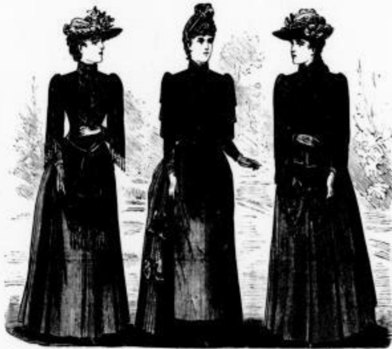
Hero. Wollstoff mit Seide gefüttert. M. 30, 35, 42.