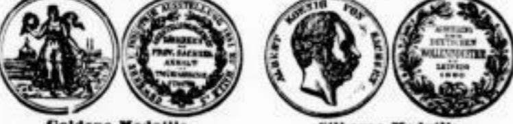
Goldene Medaille. Silberne Medaille.