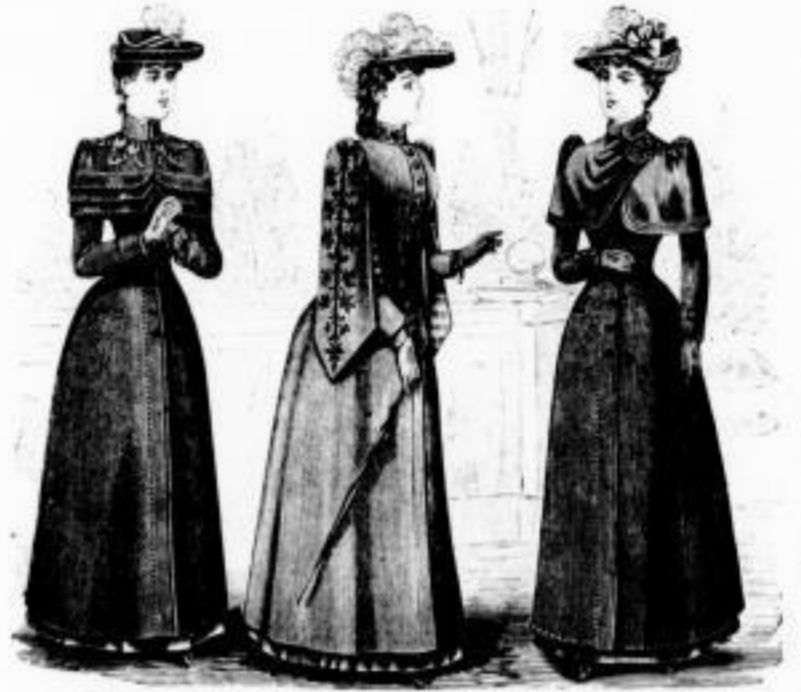
Asra. Regenpaletot mit Stickerei // 32 u. 40. ohne Stickerei // 24, 30 u. 35. Damon. Anliegender Regenpaletot // 25 u. 30. Faust. Anliegender Regenpaletot // 27 u. 36.