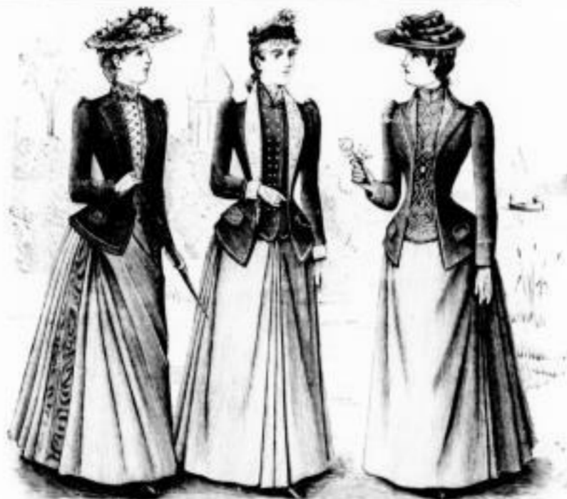
Betty. Jaquette in gestickt. Westmansatz // 21, 25 u. 28. Ernesto. Jaquette mit reicher Goldstickerei // 45 u. 52. Victor. Jaquette in silbergest. Westmansatz // 32 u. 34.