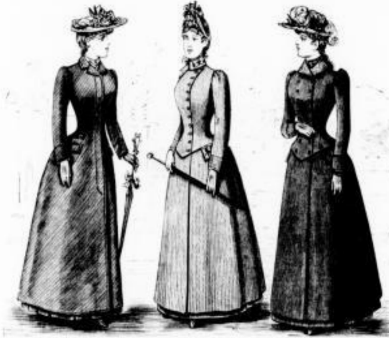
Carmen. Halbanlieg. Regenpaletot // 16, 18 u. 24. Gaston. Anliegender Regenpaletot mit Stickerei // 15, 18 u. 21. ohne Stickerei // 10, 13 u. 16. Amor. Anliegender Regenpaletot mit Stickerei // 18, 21 u. 24