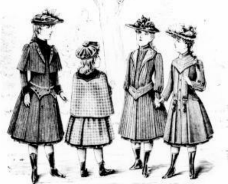
Ilse Erna Olga Paula

Kinder-Mäntel und Kinder-Jaquettes, alle Grössen in jeder Preislage.