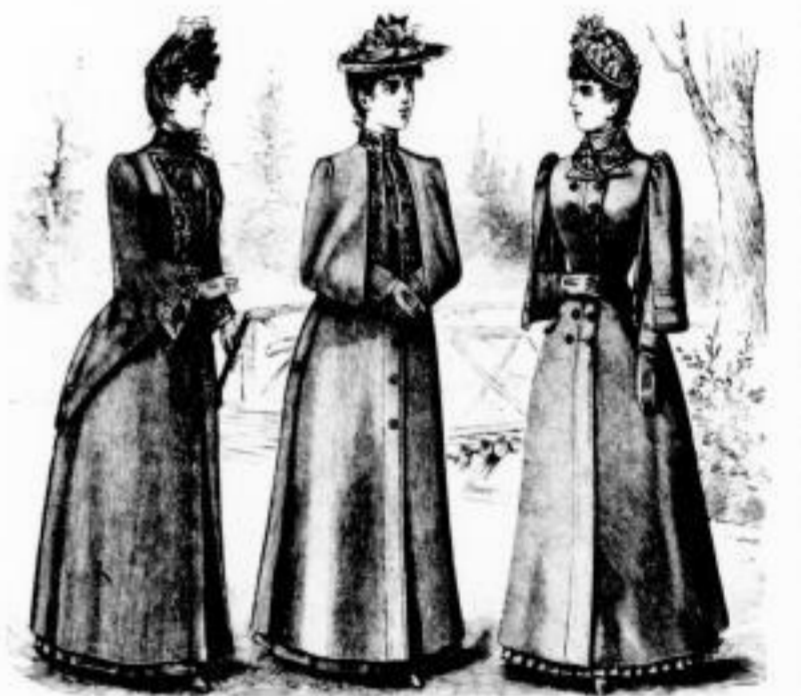
Cleopatra. Regen-Dolman, nicht gestickt // 29, ohne Stickerei // 15, 18 u. 21. Ninon. Binden-Regenmantel // 18, 24 u. 27, ohne Stickerei // 14, 16 u. 18. Gabriele. Regenmantel // 28 u. 35, ohne Stickerei // 22 u. 27.