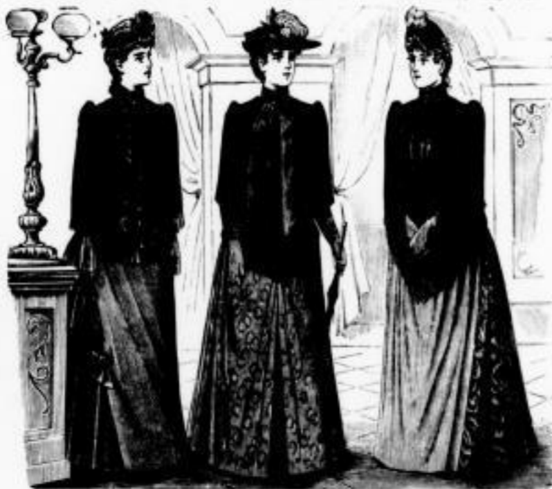
Hertha. Seiden-Matelassé mit Seide gefüttert. M. 38 u. 42.