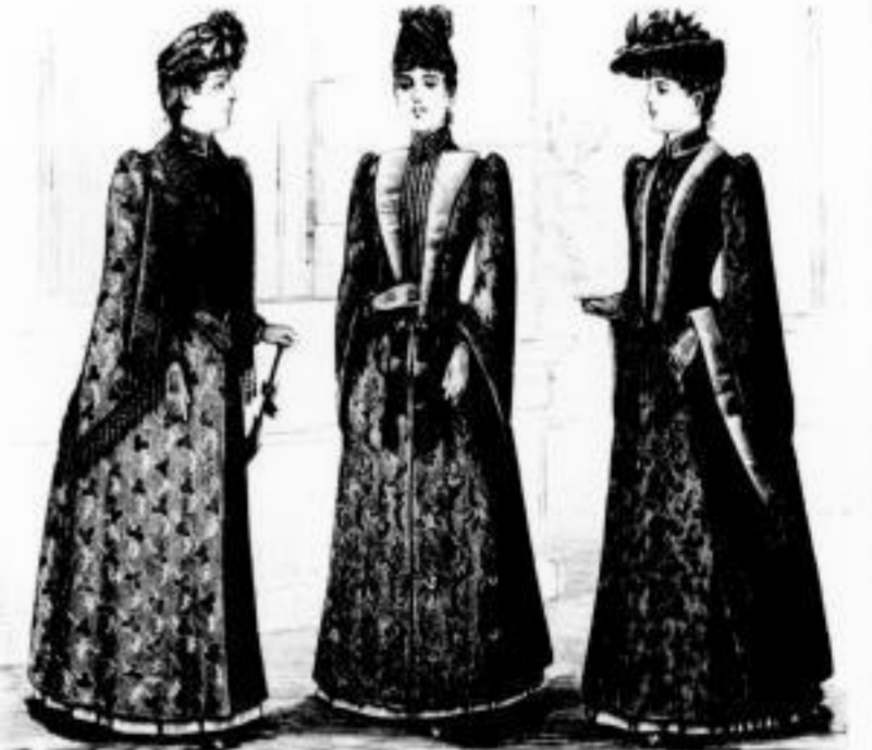
Diana. Promenaden-Mantel // 42, 54 u. 62. Hero. Promenaden-Mantel // 37, 41 u. 46. Carola. Promenaden-Mantel // 35, 38 u. 42.