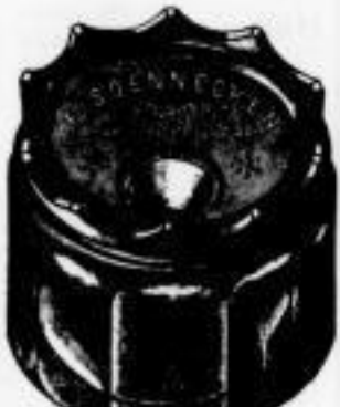
Form von Nr. 113, 114, 115 geschliffen