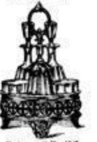
Essiggestelle von 6.- an.

Zuckerkorb Nr. 12 blau Glas weiss. 4 4.75