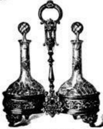
Einmachestell 61/2. 4 40.-