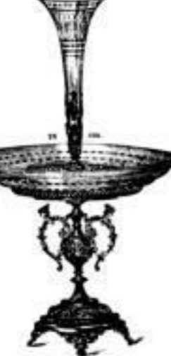
Tafelaufsätze von 9.50 an.

Nr. 44a/1 5a. (ohne et an.) Tafelaufsatz weiss. 4 13.- stergold. 4 18.-