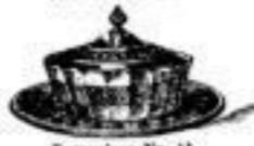
Butterdosen von 4.75 an.

Eiergestell Nr. 28 4 BucherLöffelgold. 4 13.50