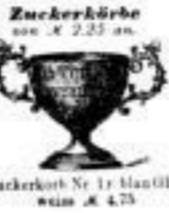
Zuckerkörbe von 2.25 an.

Essigplatte Nr. 4 weiss. 4 29.- stergold. 4 37.-