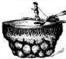
Eisgefässe von 7.50 an.

Eisbübel Nr. 13 oval weiss. 4 16.00; Einglas stergold. 4 00.50; Opal rot. 4 5.-