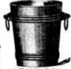
Weinkühler Nr. 9c versilbert. 4 13.- versilbert. 4 8.-

Waschschale Nr. 70 polirt weiss. 4 17.50 stergold. 4 22.-