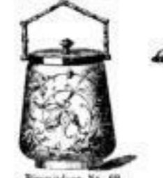
Biscuitdosen von 3.25 an.

Eisbübel Nr. 13 oval weiss. 4 16.00; Einglas stergold. 4 00.50; Opal rot. 4 5.-