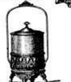
Biscuitdosen von 3.25 an.

Biscuitdose Nr. 21. Glas blau weiss. 4 11.- stergold. 4 15.50