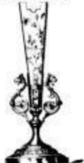
Blumenhalter Nr. 12 weiss. 4 11.- stergold. 4 13.50