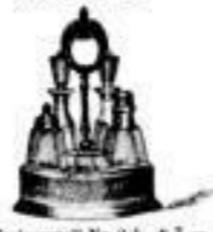
Essiggestell Nr. 23. 4 7.-