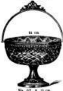
Fruchtkörbe von 5.- an.

Nr. 62. u. 63 an. Fruchtkorb blau Glas weiss. 4 10.50 stergold. 4 13.50