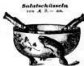
Salatschüssel von 9.- an.

Obstmesser Nr. 4112 (ohne Obtmesser) weiss. 4 5.- stergold. 4 7.50