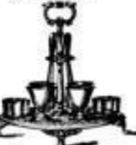
Eiergestelle von 7.- an.

Eiergestell Nr. 28 4 BucherLöffelgold. 4 13.50