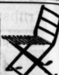
Modell Nr. 11.

Ganz v. Holz m. bequemen Lattenstuhl u. umlegbarer Lehne. Sitzhöhe 45 cm, zusammengelegt 54 cm lang, 42 cm breit, 3 cm dick.