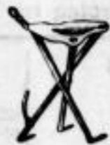
Modell Nr. 4.

Dreibeiniger, mit festem Ledersitz, zum Anhängen, zusammengelegt 54 cm lang, 4 cm dick.