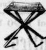
Modell Nr. 5.

Preis 5 M. 50 Pf. Derselbe grösser 45 cm lang, 7 M. 50 Pf.