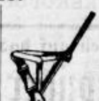
Modell Nr. 6.

Preis 3 M. Kofferbänke, in derselben Form, zum bequemem Aufliegen der Koffer, für Fremdenzimmer etc. 54 cm hoch. Preis 4 M.