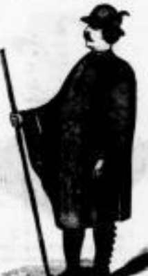
Ueber-Ueberröcke (Kaisermäntel) für Winter, mit und ohne Pelerine.

Regenmäntel in Gummi-Double-Stoff (Gummi nicht sichtbar). Leichte Gummimäntel, eleganter, in verschiedenen Farben und Mustern. Preis von 24 M. an.