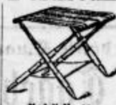
Modell Nr. 10.

Preis 6 M. 50 Pf. Umhängeriemen hierzu 1 M. extra.