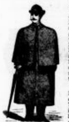
Havelok , das profitabelste u. beste Reise-Ueberkleid, welches sich wegen seiner vielseitigen Verwendbarkeit als vollständiger Ersatz für Plaid, Sommerüberrock u. Reise-Schlafrock immer mehr beliebt macht. Es leidet weder durch Zusammenpacken noch Durchsetzen oder Legen u. trägt sich viele Jahre gut und ansehnlich. Preis in leichtem Sommerstoff 20 M., in englischem Tweed, graumelirt 30 M., in Loden verschiedener Stärke 24 bis 22 M., in dickem Velour (für Winter) 26 bis 40 M.

Tiroler Wattermäntel von kräftigem, wasserdichtem Loden. Preis 12 M., mit Capuze 15 M.