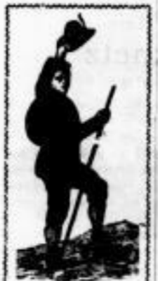
Bergjoppe für Knaben 10 M. Hut mit Feder 4 M. Rucksack 3 1/2 M.

No. 34. Dieselbe in besserem Loden, mit Umlegekragen grau mit grünem Passpol. Preis 15 M. Original Adigker Bergjoppe , wasserdicht. 4 M.