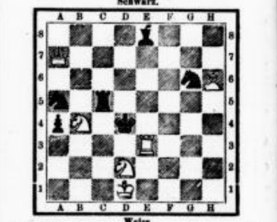
Welch zieht an und hat in drei Zügen matt. (6 + 6 - 12)