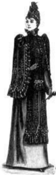
Brunhilde. M 20,— bis 37,—