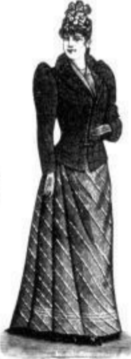
Krimhilde. M 10,50 bis 30,—