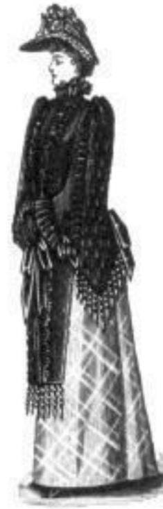
Hero. M 21,— bis 47,—