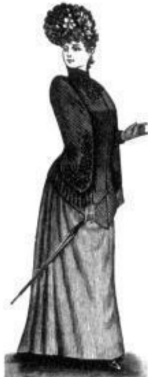
Carmen. M 21,— bis 34,—