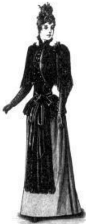
Hortense. M 32,— bis 67,—