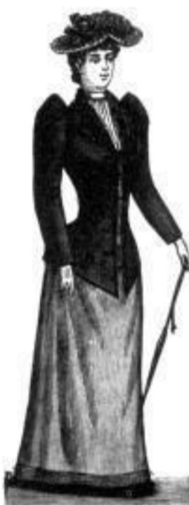
Irene M 8,50 bis 26,—