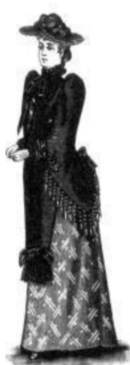
Desdemona. M 12,— bis 25,—