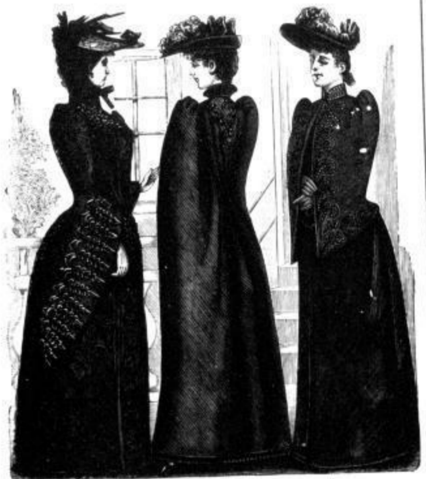
Mainz. M. 24.— bis 75.— Cassel. M. 37.— bis 62.— Dresden. M. 22.— bis 78.—