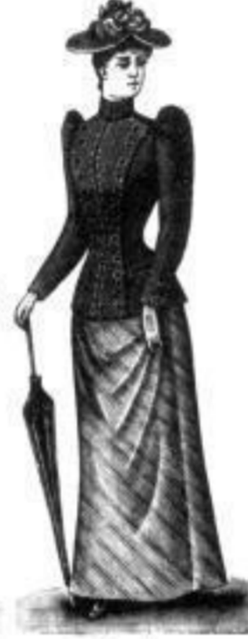
Lucie. M 5,— bis 14,—