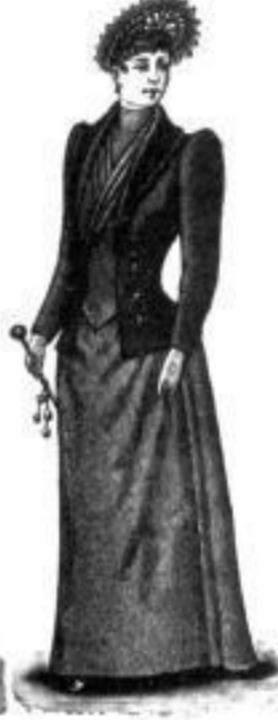
Norma. M 12,50 bis 27,—