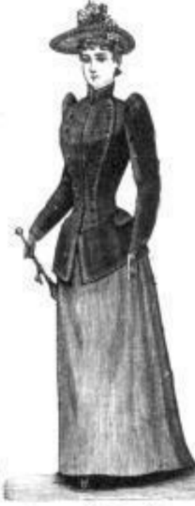
Rosenda. M 18,— bis 39,—

Kindermäntel und Jackets in allen Grössen und jeder Preislage.