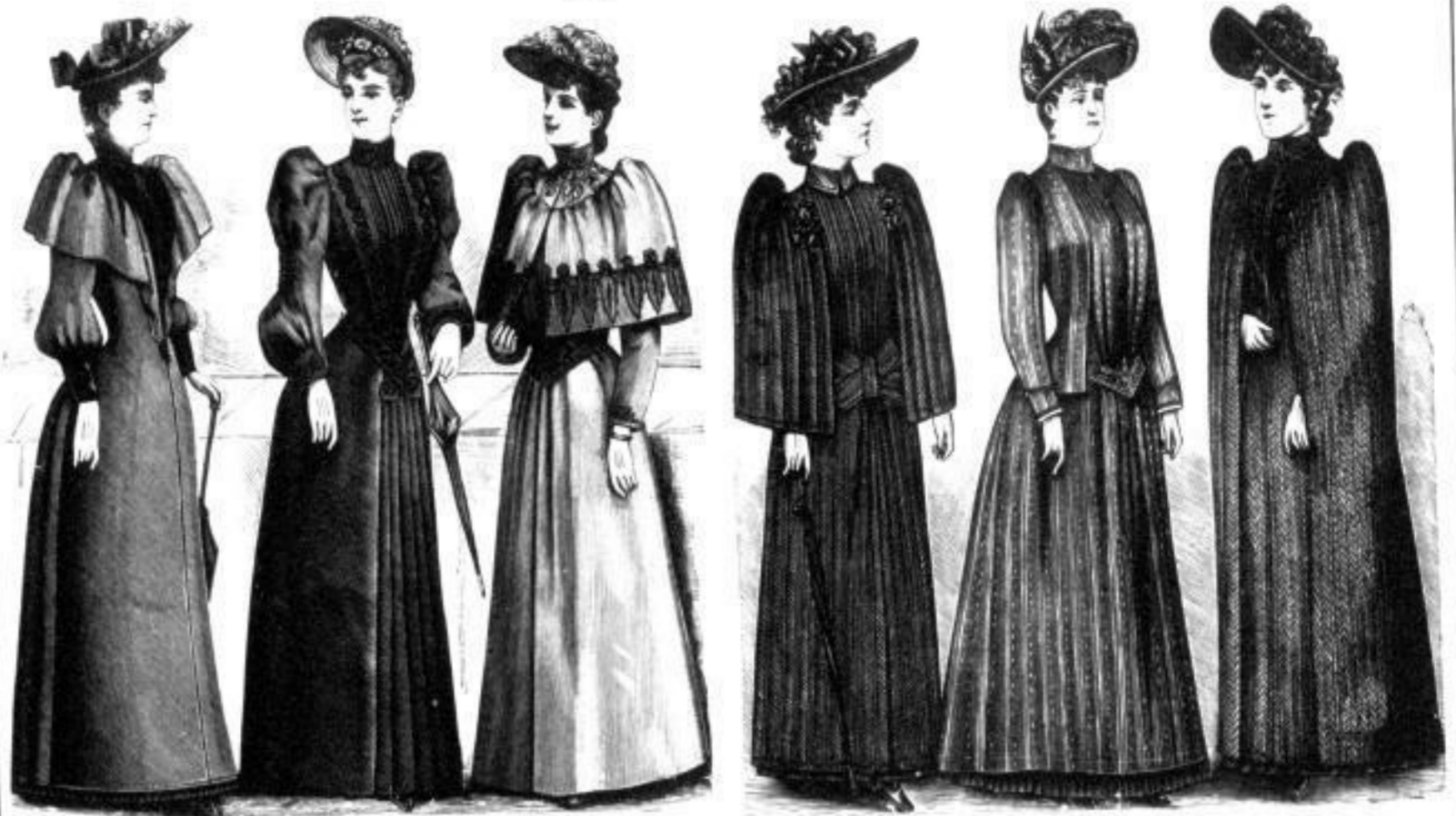
Leipzig. M. 15.— bis 45.— Ulm. M. 22.— bis 34.— München. M. 21.— bis 44.— Lindau. M. 14.— bis 39.— Constanz. M. 9.— bis 24.— Danzig. M. 18.— bis 50.—