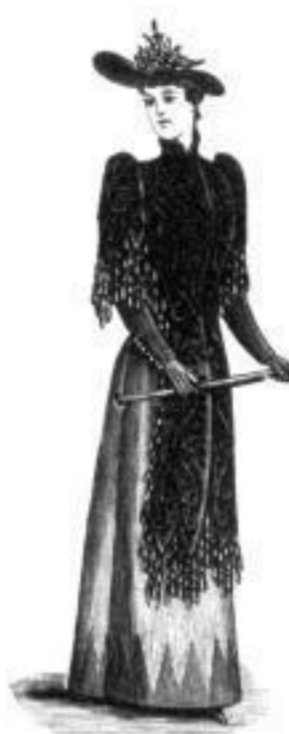
Mignon. M 14,— bis 32,—