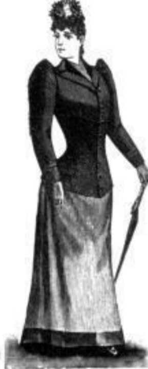
Bella. M 9,— bis 24,—