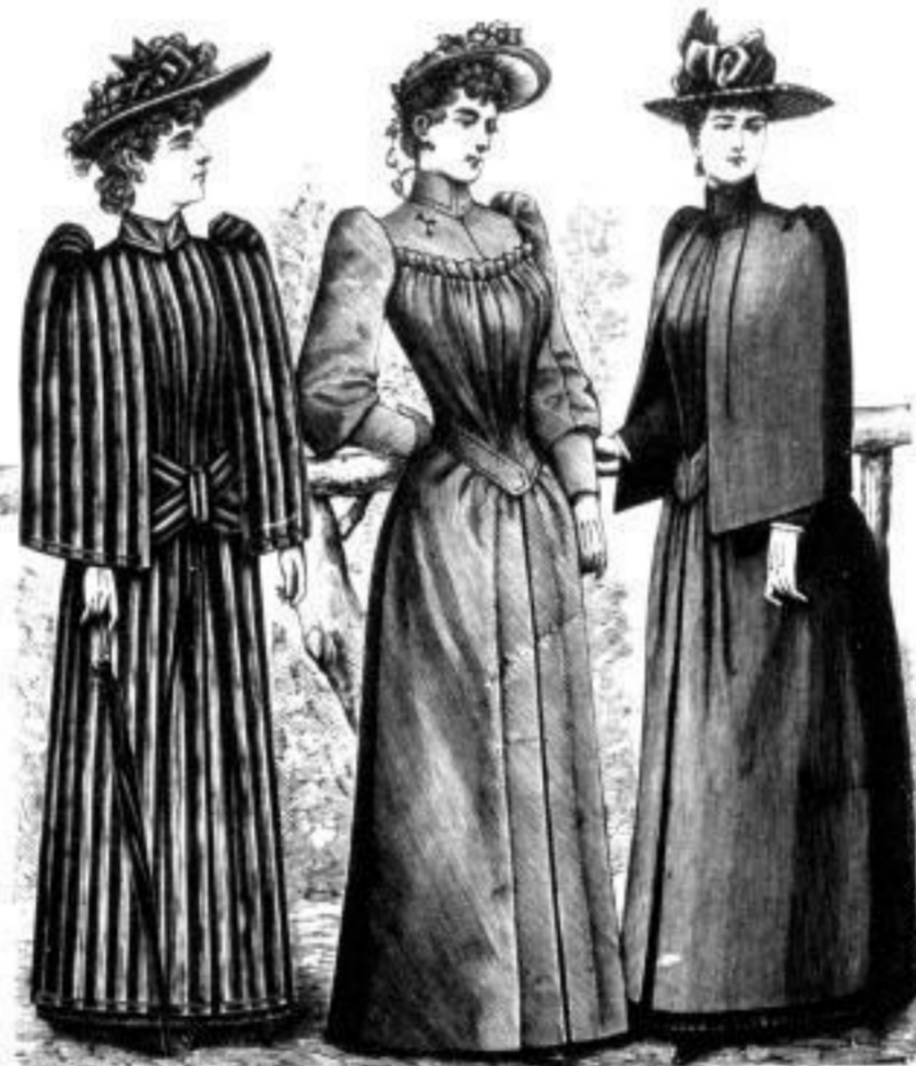
Innsbruck. M. 11.— bis 22.— Frankfurt. M. 9.— bis 27.— Stettin. M. 8.— bis 25.—