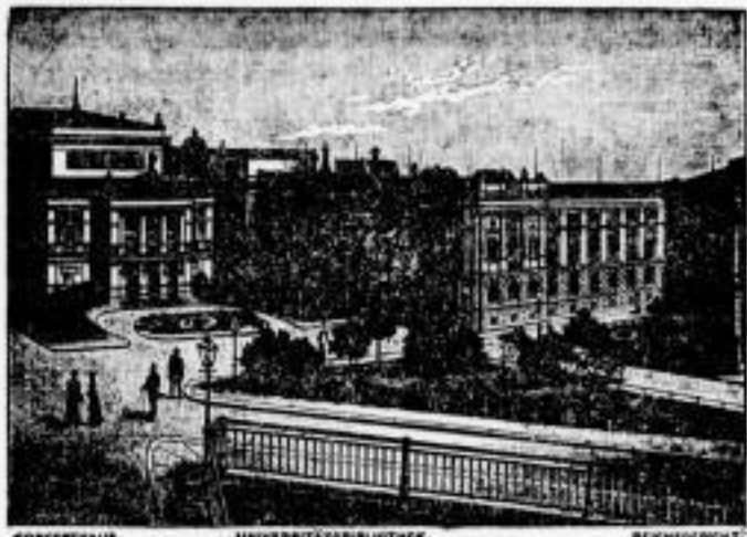
Die Komplexe I bis X (einkl. beidseitigen Plätzen) ...