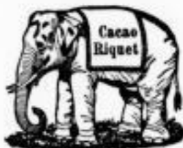
Ist frei von Pottasche etc.

Man probire Cacao Riquet Tasse an Tasse mit der bisher gehaltenen Sorte und urtheile dann! Als Maass gilt der jeder Tasse Cacao Riquet beigefügte Löffel, welcher gestrichen voll 5 Gramm Cacao enthält, während 5 Gramm Zucker den Löffel nur so weit anfüllen, dass ein Strohhalm breit am Inhalte fehlt. Nur ein kurzer Genuss genügt, Cacao Riquet jedem Cacaotrinker unentbehrlich zu machen.