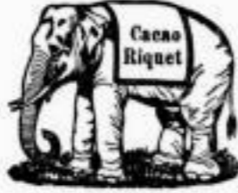
Ist leicht verdaulich