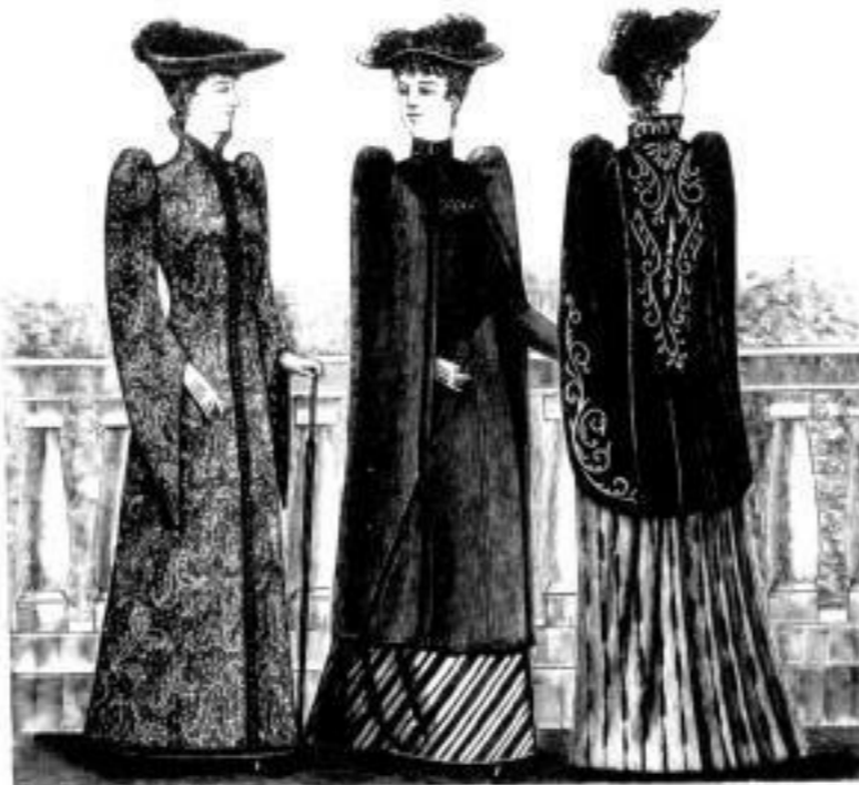
London. Paletot aus Seiden- matelassé M. 68 u. 75.