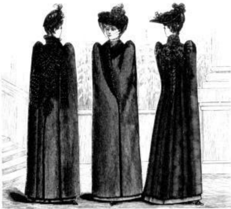
Moskau. Prag. Posen.

Radmäntel in sämtlichen modernen Formen, Stoffen und Farben mit angewebtem Wollfutter, seidenem Stepp- und Pelzfutter in allen Preislagen.