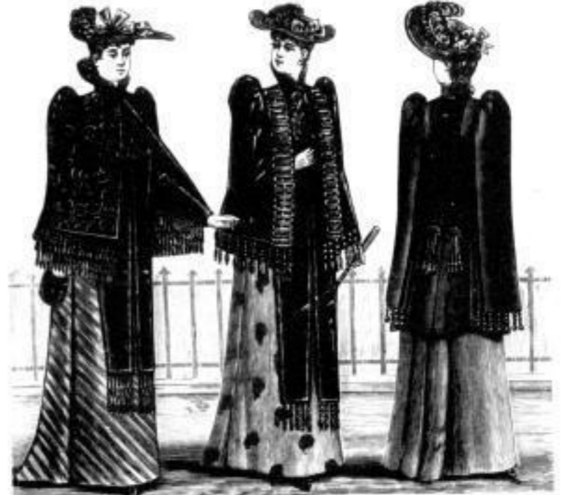
Frankfurt. Visit a. Seidenplüsch ohne Stickerel M. 68 u. 74, mit Stickerel M. 88 u. 97.