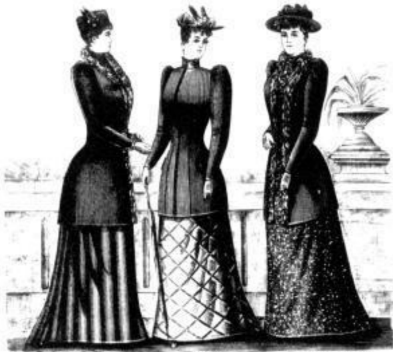
Ems. Jaquet aus Wollstoff M. 22, 27 u. 36. aus Seidenhüsch M. 54, 66 u. 78.