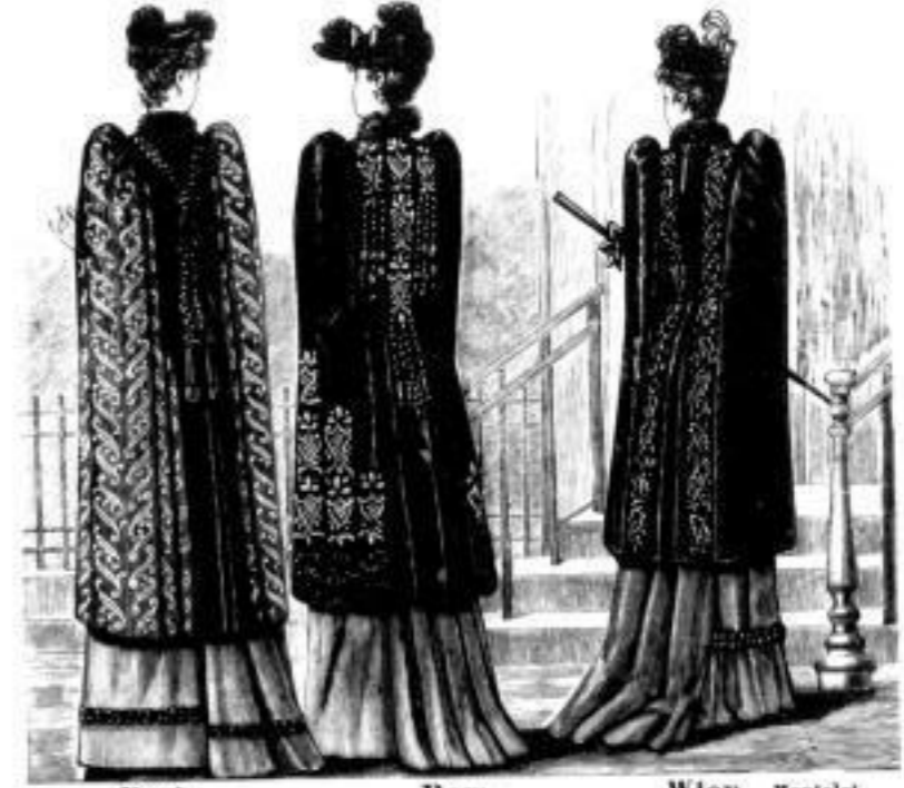
Paris. Mantel aus Seiden- matelassé. M. 38, 45, 55, 65 u. 76.