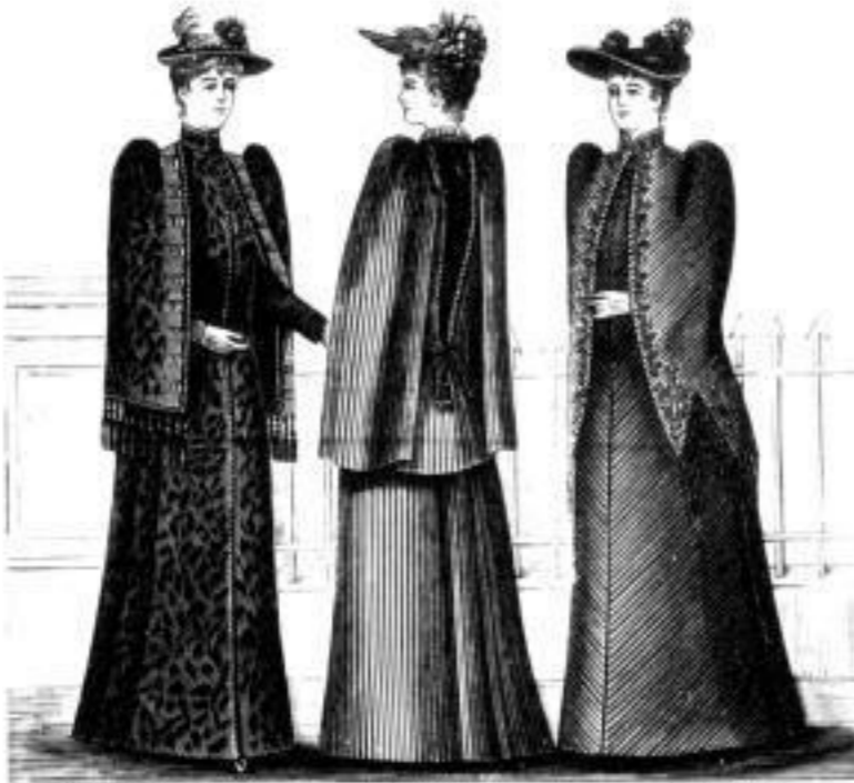
Königsberg. Clistrin. Danzig.

Paletot aus englischem Wollstoff M. 75 u. 86. Paletot aus Wollstoff M. 20, 28 u. 32. Aus Tuch u. seid. Steppfutr. M. 42, 54 u. 65. Paletot aus Wolstoff mit Pelzbesatz M. 45, 58 u. 64. Aus Tuch u. seid. Steppfutr. M. 85, 96 u. 112.