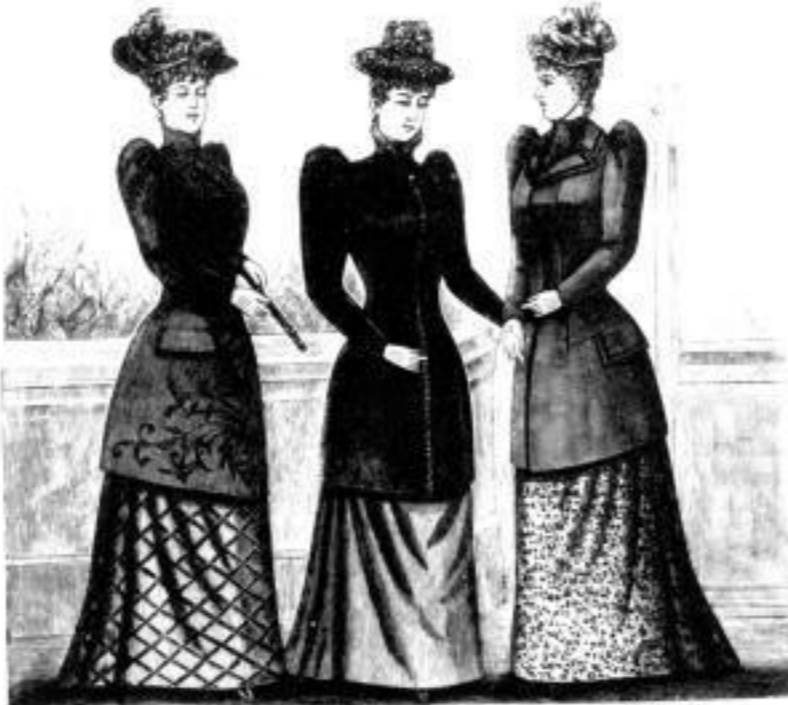
Coblenz. Jaquet aus Wollstoff, bestickt M. 16, 19, 24 u. 35.