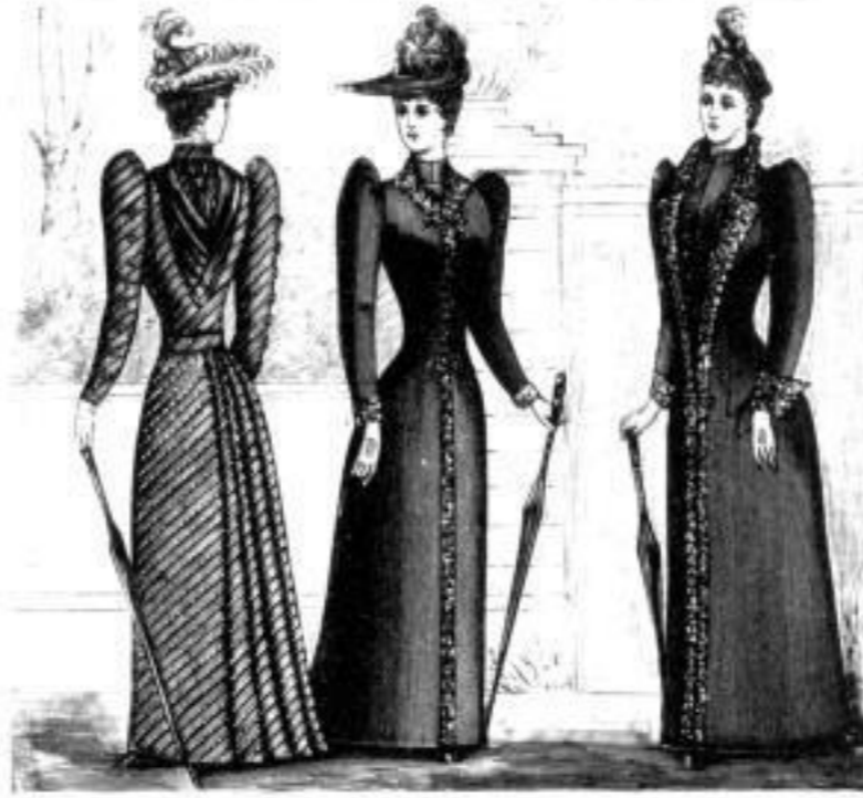
Genf. Luzern. Zürich.

Radmäntel in sämtlichen modernen Formen, Stoffen und Farben mit angewebtem Wollfutter, seidenem Stepp- und Pelzfutter in allen Preislagen.