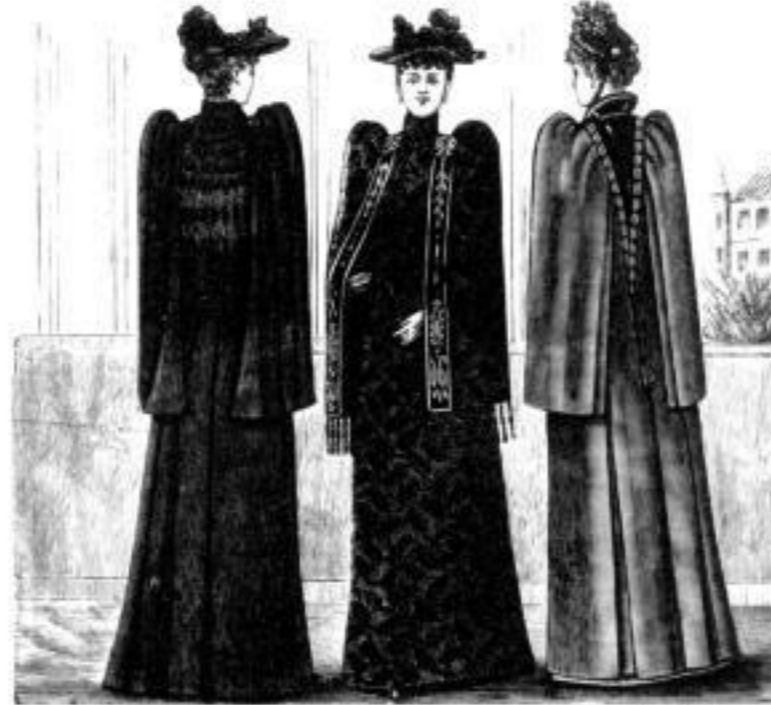
Stettin. Colberg. Ebing.

Mantel aus Astrachan. M. 36, 42, 53 u. 67. aus Wollstoff M. 22, 27, u. 35. Mantel aus Wollstoff M. 25, 32, 46 u. 54. Mantel aus Wollstoff M. 47, 52 u. 64.