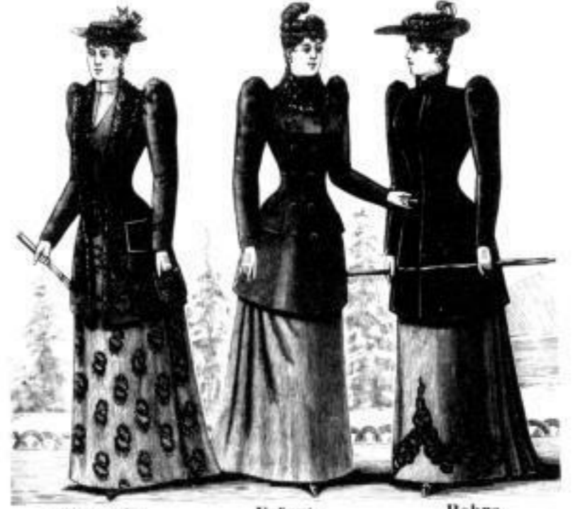
Eisenach. Jaquet aus Wollstoff, reich bestickt M. 36, 48 u. 62.