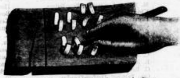
Handliche Darstellung der Klammereinführung aus dem Eisen.