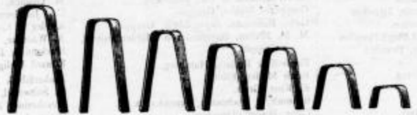
Vertikale Griffe der Klammern.

Nachfolgende Holzschnitte wurden erst fertig, als die Galvanos des Prospektes angefertigt waren, weshalb ich die nicht an der richtigen Stelle bringen konnte.