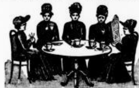
Wir trinken Alle Caeno mit Schlagsahne.

Neu eröffnet! Neu! Wolfsschlucht, Brühl 35. Täglich Concert.