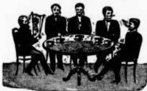
Wir trinken Alle Weltkaffee.