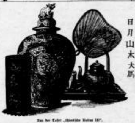
Das bei Cestl, „Meyers Teapot“

Die Illustrationsbeilagen wurden ebenfalls unsere erhöhten Anforderungen entsprechend vielfach durch neue Darstellungen ersetzt und um einige Hundert vermehrt, darunter ungefähr 150 Chromotafeln von hervorragendem künstlerischen und wissenschaftlichen Wert.