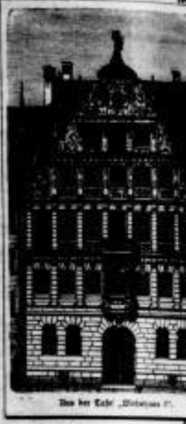
Das bei Cestl, „Bibliographisches Institut“

So übergeben wir dem deutschen Volk von neuem unser monumentales Werk, das in jeder Hinsicht verbessert, vermehrt und veredelt ist, in der Überzeugung, dass Vollkommenheit auf dem Gebiete der encyclopädischen Litteratur erreicht zu haben. Ein vollständiges Wörterbuch des menschlichen Wissens, alles, was der Ideengang der modernen Weltbildung erheischt. Es unterrichtet in allem, was Wissenschaft und Erfahrung zur menschlichen Kenntnis gebracht haben, und zwar mit der Vollständigkeit spezieller Hand- und Lehrbücher, deren es eine ganze Bibliothek in sich vereinigt. Möge es deutschem Fleiß und Geist zur Ehre gereichen und Aufklärung und Bildung in immer weitere Kreise tragen.