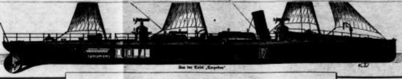
Das bei Cestl, „Lepros“

Hand in Hand mit der textlichen Neugestaltung und wesentlichen Erweiterung des Werkes geht eine planmäßige Ausbesserung des illustrativen Teiles. War „Meyers Konversations-Lexikon“ schon bisher in dieser Hinsicht bahnbrechend, so sind die umfangreichen Vorbereitungen der neuen Auflage auch hierin als ein bedeutender Fortschritt zu bezeichnen.