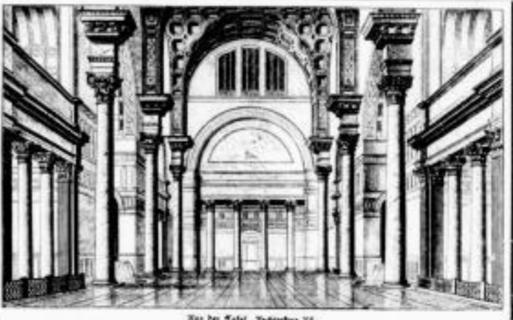
Siehe die Karte „Verkehrs-V.“

Empfohlen durch die Buchhandlung Gustav Fock in Leipzig, Neumarkt 40 u. Magazingasse 4.