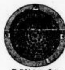
Ansicht von oben.