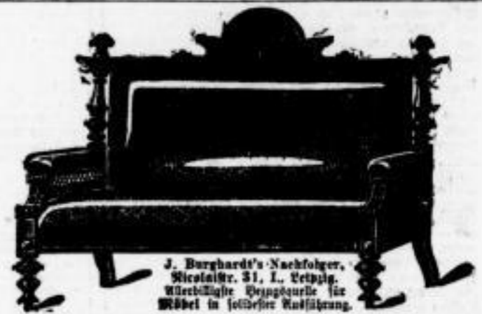
J. Burghardt's Nachfolger, Nicolaistr. 31, I. Leipzig. Kunstvolle Bezugsquelle für Möbel in jeder Ausführung.

Wir offeriren billigt in bester Waare, sowohl in Wagenladungen direct als Werks, als auch in kleineren Posten ab Levy oder unseren hiesigen Lagerstätten und frei Gelde ab Hof: Westfälische — Pflanzgasen — Anthracit-Kohlen, staubfrei, wenigste Rückstände hinterlassend und an Heizkraft laut Analyse beste englische Marken übertreffend; Westfälische — Gustav Schulz-Boehm — gedrochene Koke Niederschles. — Gottesberg — Centralheizungen, Leipziger und diverse — grosse u. gehack. (Meid.) — Gaskoke, sowie alle Sorten Stein- u. Braunkohlen, Brikets etc. für Hausbrand und Fabrikbedarf. C. Hoffmann-Ebeling & Co., Leipzig, Emilienstrasse 21. — Fernsprech-Amt IV, 2089.