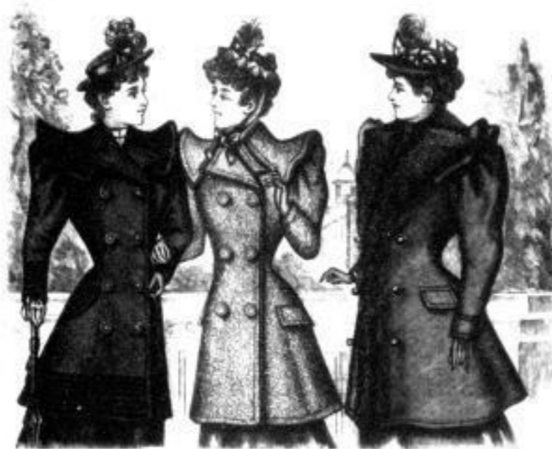
Hansa Halblängere Jacke mit Fellevertonne in allen Größen, glattes Stoff Mk. 18, 25 u. 35, einfacher Mk. 18 u. 17 Virginia Halblängere Jacke in an- liegender Form Mk. 5, 6 u. 8, in Lockstoff Mk. 12, 15 u. 18 Valesca Halblängere Jacke mit reinem Fellevertonne Mk. 21, 24 u. 31, einfacher Mk. 14, 18 u. 21