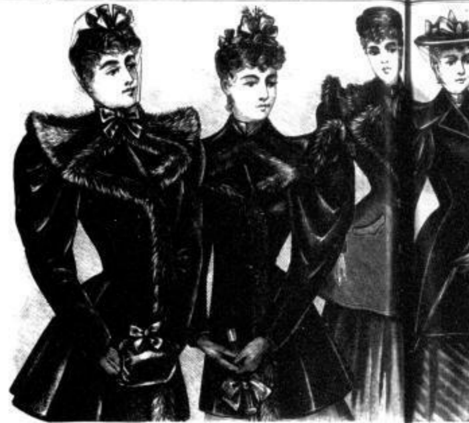
Vineta Vollständige Jagdjacke mit einem Pelz ausgestattet Mk. 110 bis 200. Medea Vollständige Jagdjacke mit einem Pelz ausgestattet Mk. 90 bis 180. Gisela Halblängliche Jagdjacke glatten Stoffen Mk. 18 bis 30. Helen Vollständige Jagd- jacke Mk. 80 bis