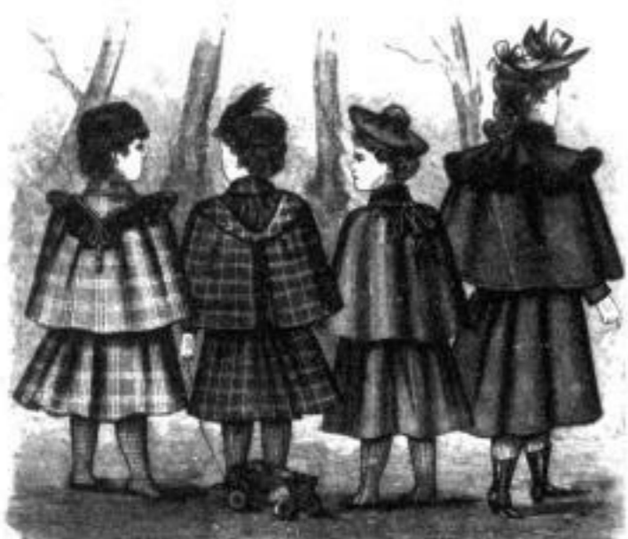
Eise Käthe Olga Paula