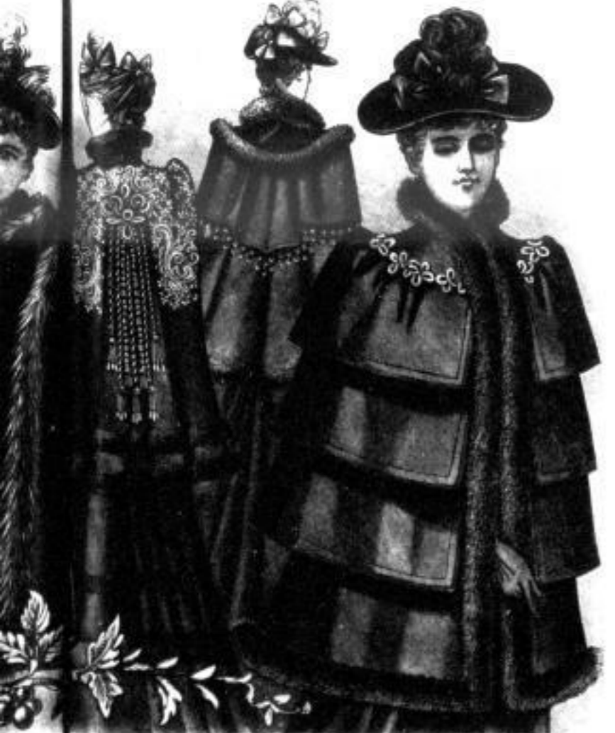
Helene Cape, kurze Form Mk. 45 bis 120 Denise Cape, kurze Form Mk. 41 bis 65 Diana Cape, kurze Form Mk. 55 bis 82