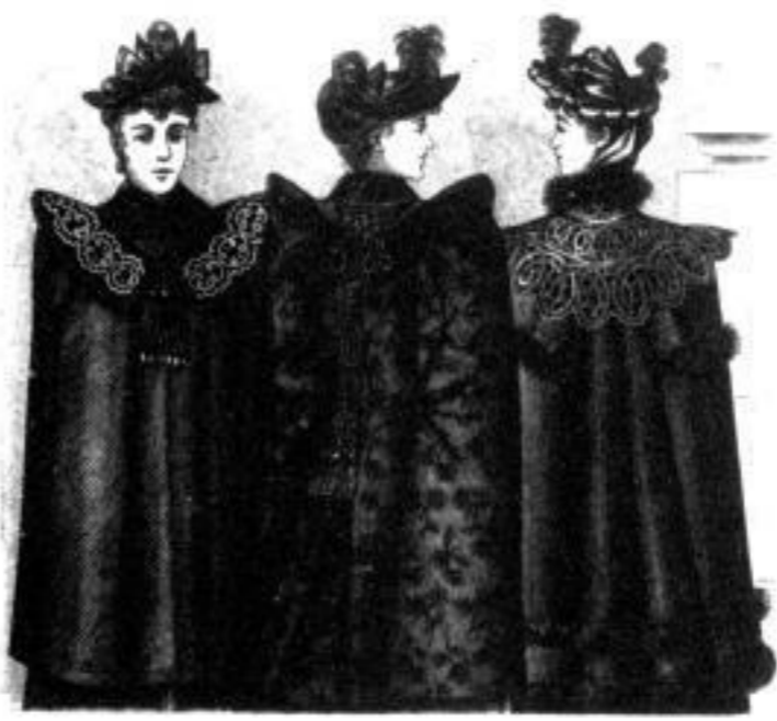
Seba Cape aus Chevre- oder Kamm- garbstoffen Mk. 25-34, einfacher 15-22 Undine Cape aus Mohair- oder Wollstoff Mk. 31-53, einfacher 18-30 Titania Cape aus Kammgarbstoffen mit Fellevertonne und Fellevertonne Mk. 15-75