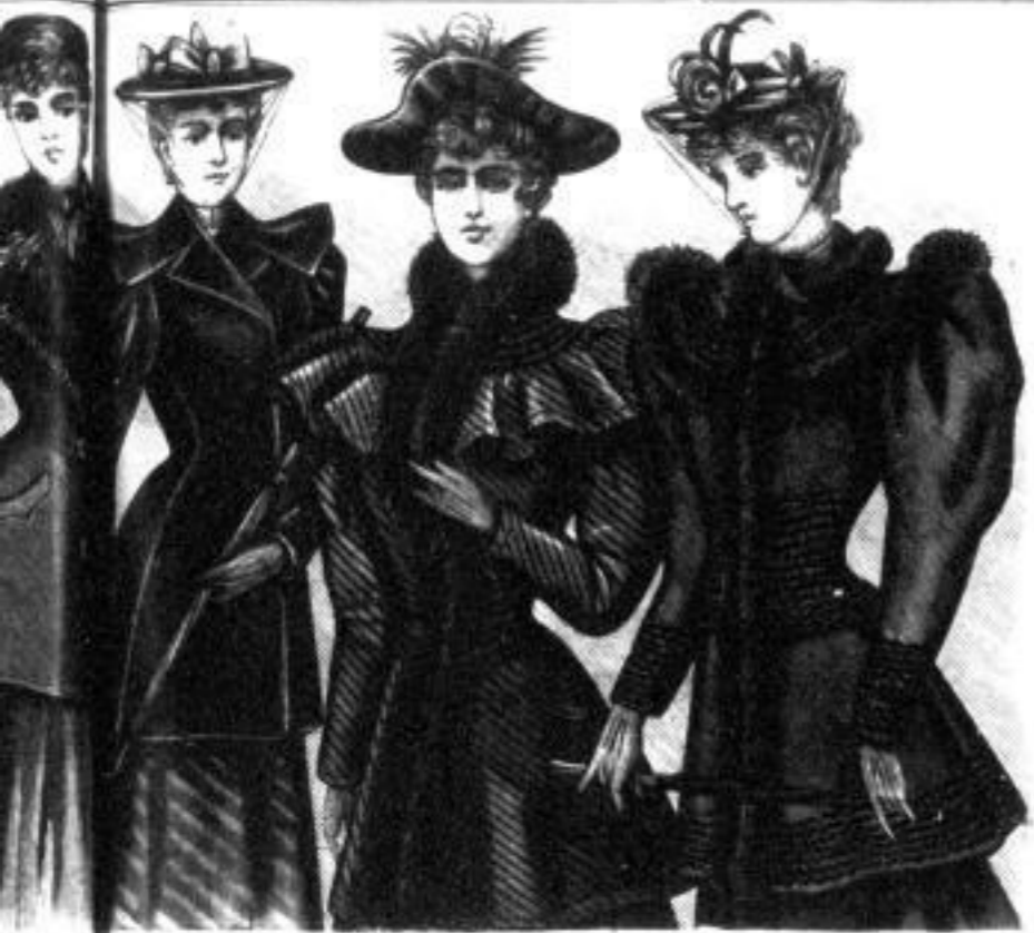
Isela Halblängere Jacke in vier- eckigen Form Mk. 18 bis 30 Hero Halblängere Jacke in vier- eckigen Form Mk. 30 bis 100 Isolde Anliegende Jacke mit Ure- oder Fellevertonne Mk. 24 bis 45 Aida Anliegende Jacke, reich ausgestattet mit Ure- oder Felle- vertonne Mk. 26 bis 64