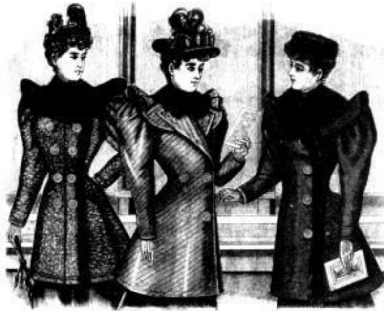
Nora Halblängliche Jagdjacke in matt gestreifter Stoffe Mk. 25, 31 u. 37. Odette Halblängliche Jagdjacke hellen und dunklen Stoffen Mk. 18, 24 u. 30. ohne Pelz Mk. 10, 12 u. 15. Fortuna Halblängliche Jagdjacke in dunklen glatten und rasierten Stoffen Mk. 18, 18 u. 21. ohne Pelz Mk. 8, 10 u. 14.

Der Einzelverkauf geschieht nur gegen Casse zu streng festen Preisen.