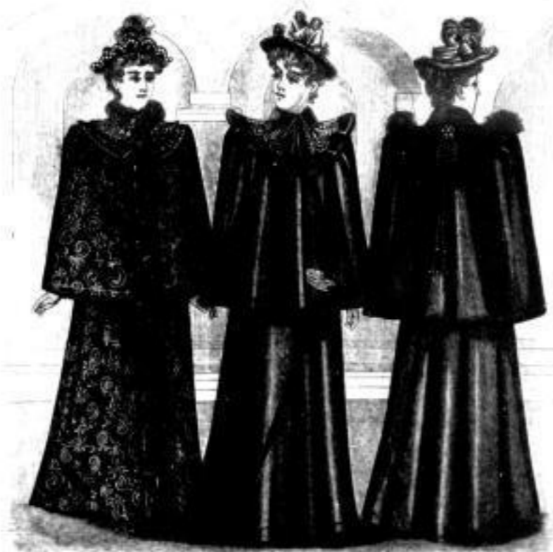
Chicago Langer Frauenmantel aus Wolle Mk. 35, 41, 54 u. 66. Bagdad Langer Frauenmantel in Kaschmirstoff mit Fächer Mk. 24-45 einfacher Mk. 15-22 Odessa Langer Frauenmantel in Kasch- mirstoff mit Fächer Mk. 35, 41 u. 52 einfacher Mk. 22 u. 29