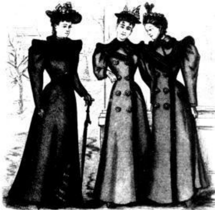
Milan Damenpelz je nach Pelzart von Mk. 110 bis 350. Coriolan Halblänglicher Paletot in glatten, dunklen Stoffen Mk. 25 u. 31. einfacher Mk. 15 u. 20. Castor Halblänglicher Paletot in glatten und in Kaschmir stoffen mit Trossen und Eis- gehäuter Mk. 28 u. 41, mit Fächer Mk. 24 u. 28.