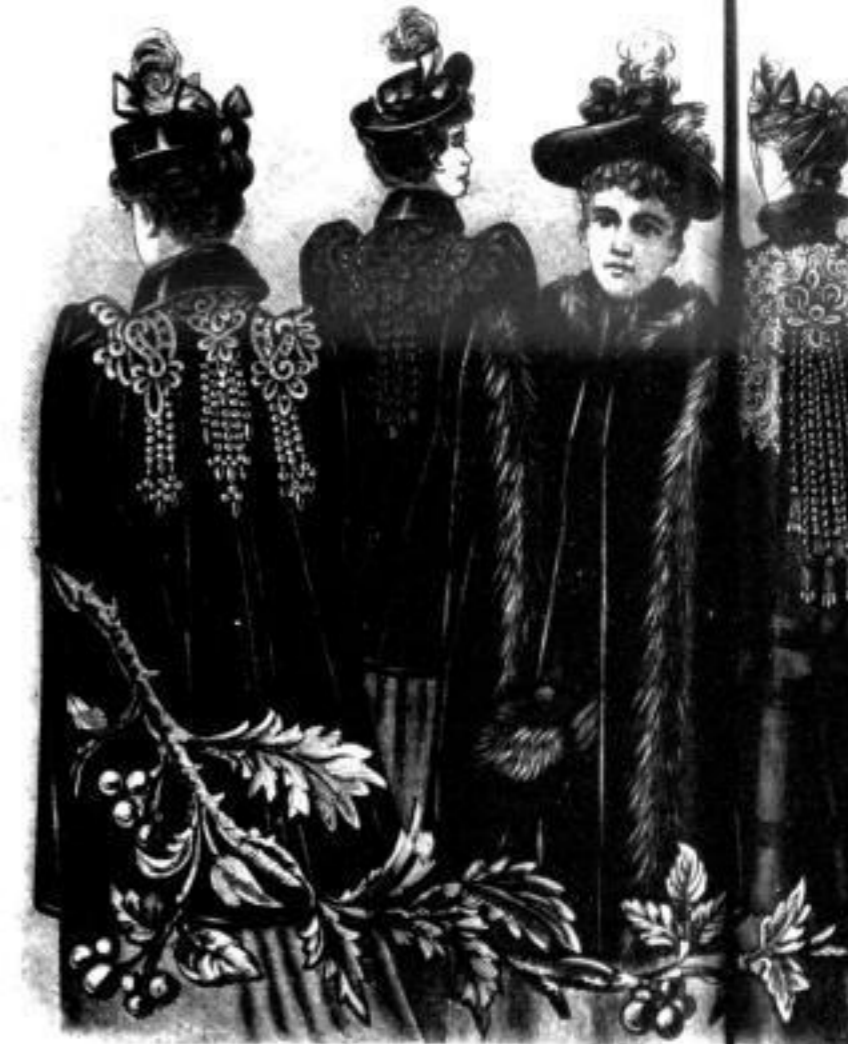
Hertha Cape aus Seidenstoff mit reinem Fuchspelz-Abstreifen Mk. 70 bis 92. Bavaria Cape aus Seidenstoff mit einfacher Fuchspelz-Abstreifen Mk. 60 bis 84. Cornelia Cape aus Seidenstoff oder Fuchspelz Mk. 95 bis 120 Helen Cape aus Seidenstoff mit reiner Fuchspelz- Abstreifen Mk. 65 bis

Jeder Mantel wird innerhalb 3 Tagen und nur bis mittags Uhr u