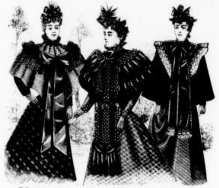
Dämon Preciosa Flora Levertrocken mit Spitze und Kinnabschließ. Mk. 30 bis 45, darüber von Mk. 5 an. hochlegantes kurzes Felle in reichster Ausstattung mit Spitze, Fuchsig und Felle Mk. 45 bis 100. Levertrocken mit Spitze und Kinnabschließ Mk. 12 bis 20.