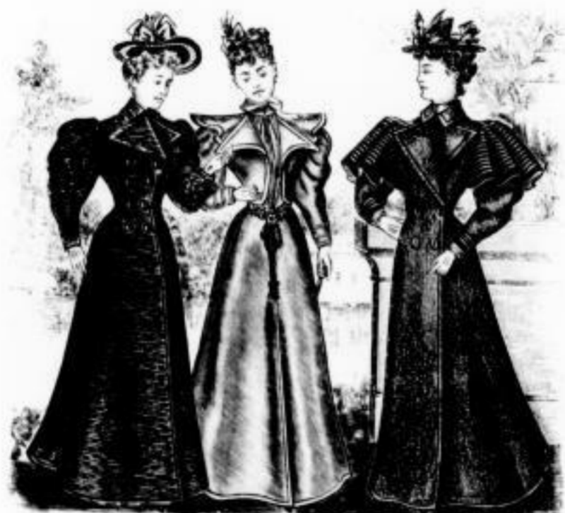
Raoul Regenpaletot in spärlich englischen Stoffen Mk. 29 bis 45 Fiesco Regenpaletot mit Weiss und reicher Passanterie in Tuchstoff Mk. 32 bis 48 Merlin Regenpaletot in englischen Stoffen mit Epauletten Mk. 20 bis 28

Jeder Mantel wird innerhalb 6 Tagen und nur bis mittags 12 Uhr