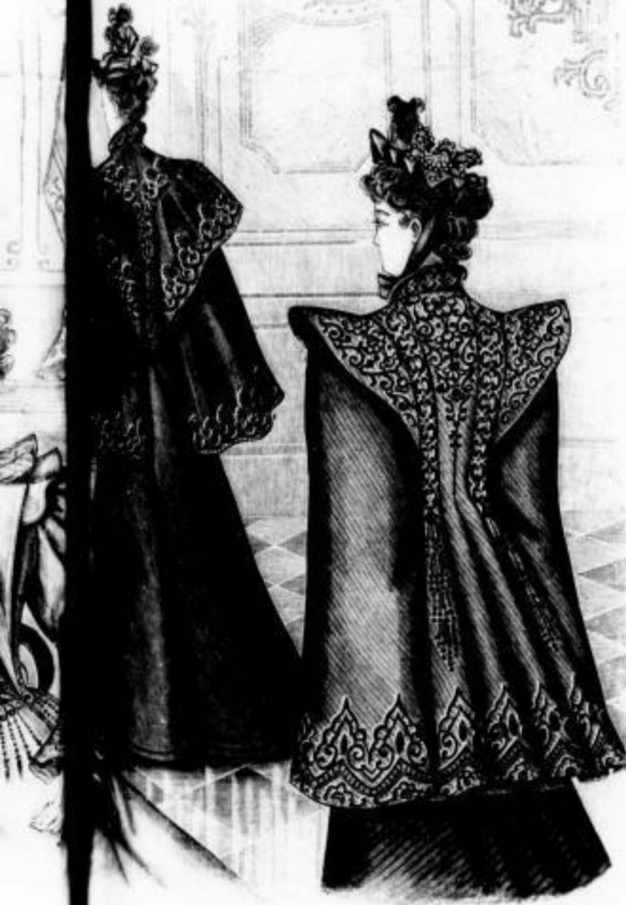
Gracieuse Regen-erwanger Frauenmantel mit reicher Stickerei, Futter mit Seide gefüttert Mk. 60 bis 90. Hermione Elegantes, schwarzes Cape mit reicher Soutache und Passenstrie, ganz mit Seide gefüttert Mk. 54 bis 100.