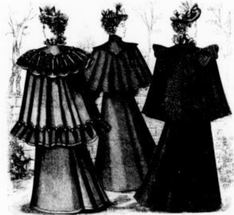
Eboli Regen-Frauenmantel mit weicher Passenstrie und Stoffkragen Mk. 30 bis 50. Felicitas Regen-Frauenmantel, besonders aparter Stoff mit Karotten Kragen, der besonders zu tragen ist Mk. 20 bis 35. Asra Regen-Frauenmantel in Reide und dunklen Stoffen mit weicher Passenstrie Mk. 18 bis 25, weiterer Mk. 7 bis 11.