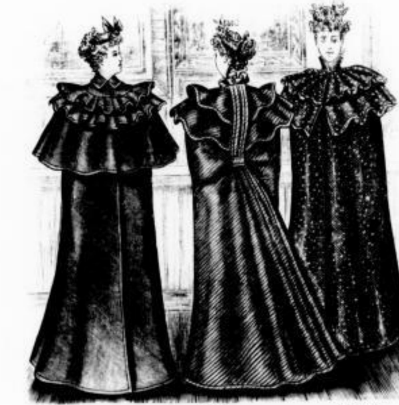
Niobe Dião Beate Radmäntel in den verschiedensten Formen und Stoffen in jeder Preislage von Mk. 10 an.

Ich bitte, meine Verkaufsräume Vormittags aufzusuchen, da in den Nachmittagsstunden bedeutender Andrang ist.