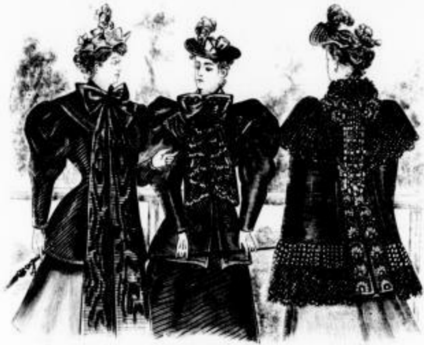
Pallas Jaquette in schwarz und farbig mit Elfenbeinbleibe Mk. 12 bis 20 ohne Schöße Mk. 4,50 bis 8 Sirene Jaquette in schwarz und farbig in besonderer Ausführung mit starker Elfenbeinbleibe Mk. 18 bis 34 Beauté Sommeranzug in gleicher Art und Farbe mit Perlenschnur Mk. 28 bis 45

Der Einzelverkauf geschieht nur gegen Casse zu streng festen Preisen.