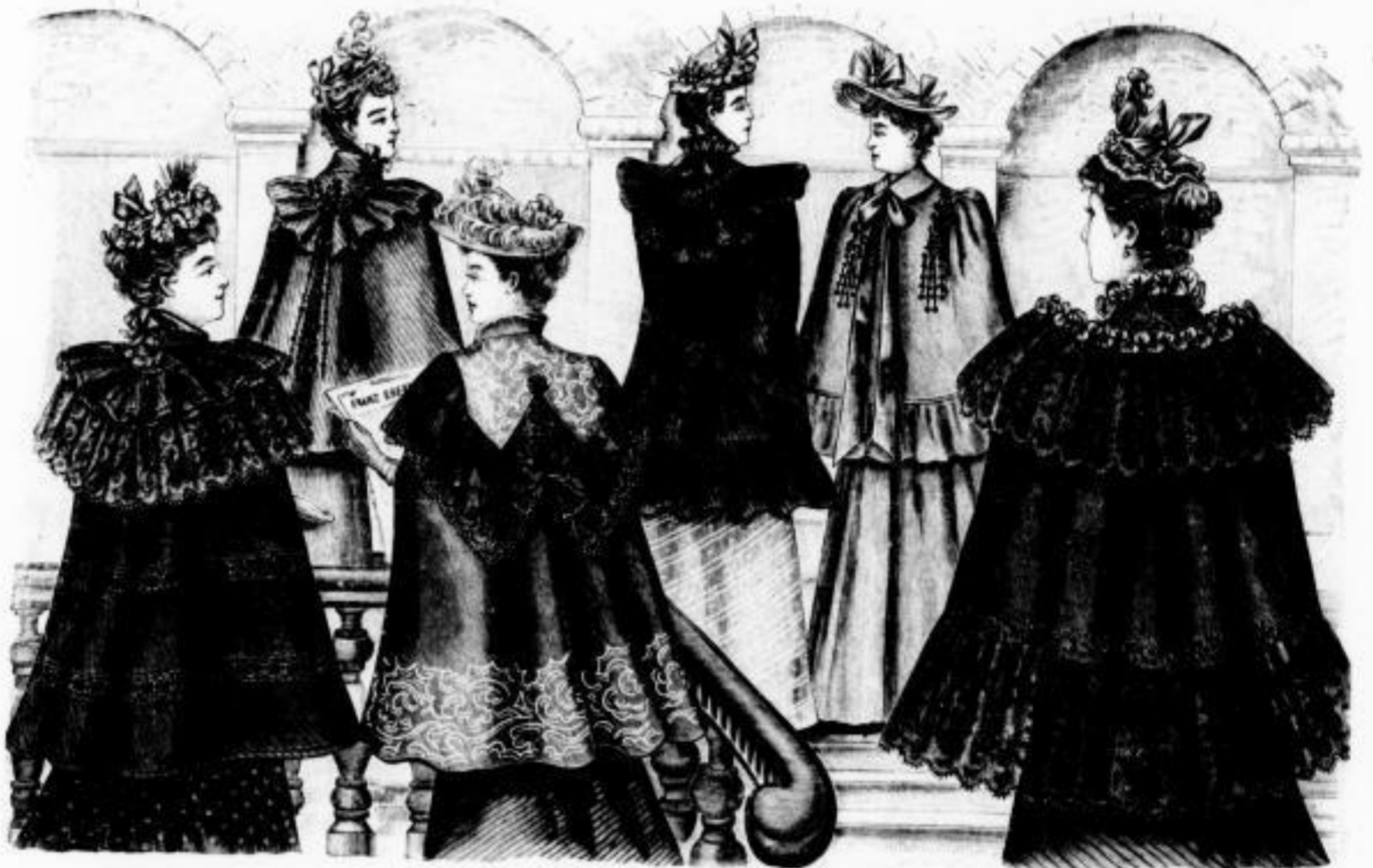
Elvira Mars Porzia Nelly Pandora Gasparone Sommerumhang mit Spitze Knöpfen und Passenstreifen Mk. 18 bis 27. Schwarzer Promaden- mantel mit Passenstreife, trägt allein zu tragen. Mk. 16 bis 31. Cape mit Spitze und Stickerei Mk. 25 bis 60. Schwarzes Cape mit Fuchsschleife und Schelle Mk. 8 bis 14. Sommerumhang mit reicher Spitzenausstattung und stumpfer oder Fortleggaratur Mk. 20 bis 42.