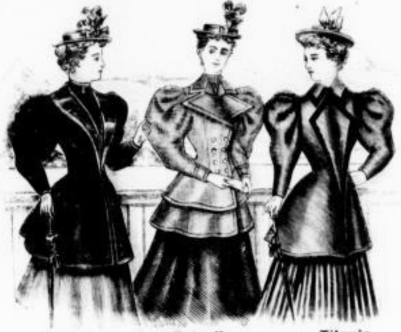
Senta Jackette mit Montegarditur Mk. 10 bis 18. Estrella Jackette mit zwei oder drei hohen Schößen mit und ohne weichen Futter Mk. 18 bis 45. Titania Jackette geschlossen und offen zu tragen Mk. 25 bis 40.