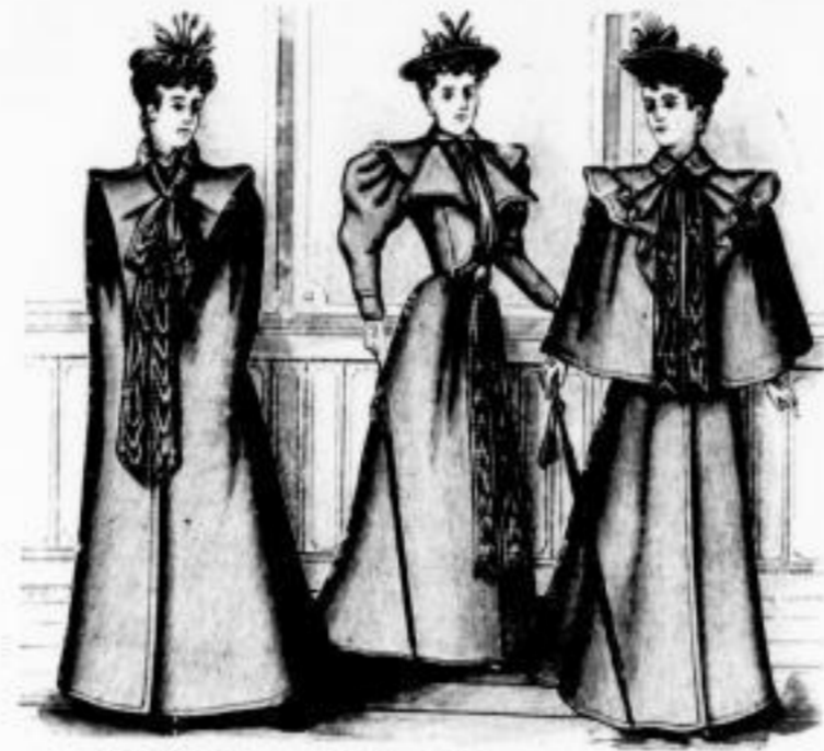
Eleonore Columbia Adele Staubmäntel in den verschiedensten Formen und jeder Preislage.