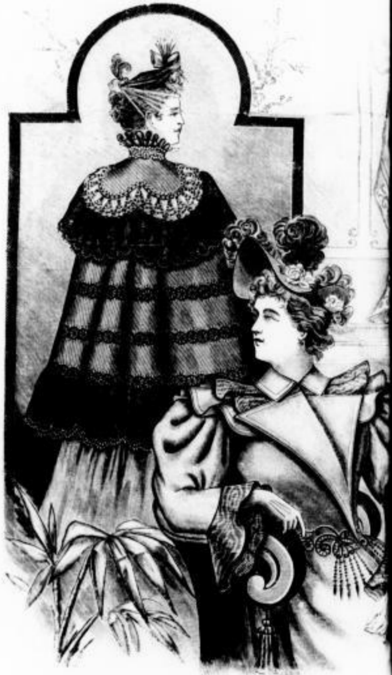
Aspasia Eleganter Sommeranzug mit Zeischensatz, reicher Perleangriffel und Bourdonspitze Mk. 65 bis 100 Figaro Eleganter Regenpaletot in schwarzem Cheviot mit reicher Moirée und Passanterie Mk. 45 bis 60