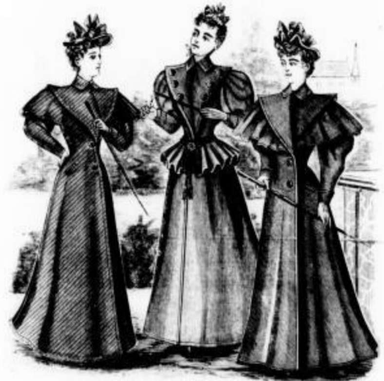
Pedro Regenpaletot in Diagonalstoff Mk. 18 bis 25 in glatten Cheviot Mk. 10 bis 17 Rienzi Regenpaletot mit angestrichenem Stoff und reicher Passanterie Mk. 28 bis 45 Jago Regenpaletot in glatten dunklen Stoffen Mk. 7 bis 11