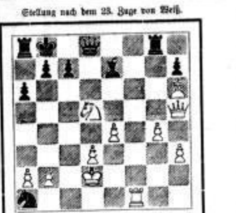
Stellung nach dem 23. Zuge von Weiß.

Es ist uns durch die Güte der Herren... (Detailed chess news including tournament results, player profiles, and chess-related events. The text discusses various tournaments, such as those in Leipzig, and mentions prominent players like Schach and Schach.