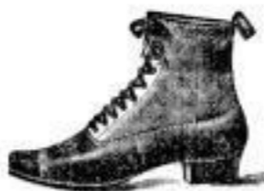
Herren-Schnürstiefeln in eleganten Formen 8 - 4