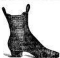
Damen-Leder-Stiefeln höchst vorzüglich u. solid 4.50 - 4 empfiehlt das seit 33 Jahren anerkannt grösste und reichste Geschäft