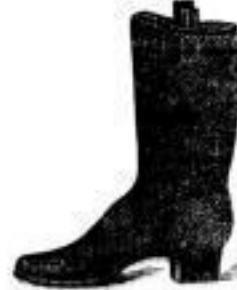
Herren-Schaftstiefeln Ganzleder 5.90 - 4

Gummi-Schuhe für Herren 3.00 - 4, für Damen 2 - 4