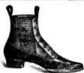
Herren-Stiefeletten, Ganzleder, mit eleg. Knopfschmückung 5.90 - 4