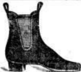
Herren-Stiefeletten, Ganzleder, ohne Besatz 4.50 - 4