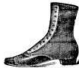
Damen-Knopf-Stiefeln eleg. engl. Schnitt 6 - 4