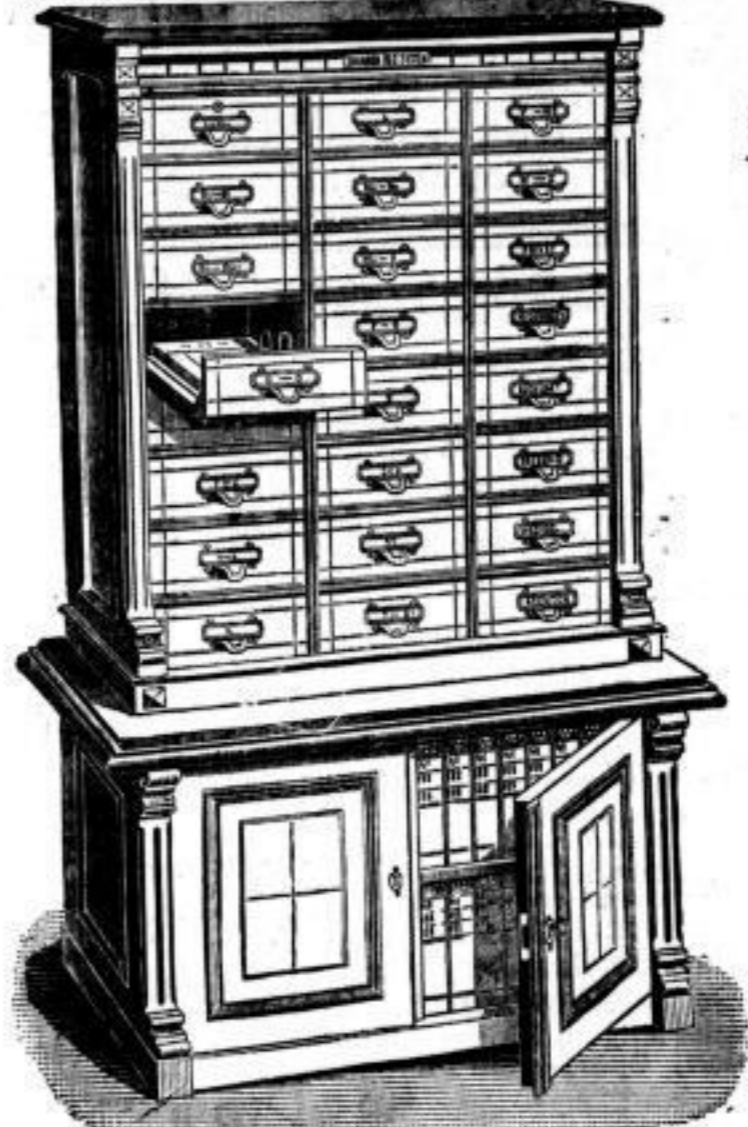
Grösse: circa 200 cm hoch, 110 cm breit, 50 resp. 36 cm tief.

(System Zeiss) enthaltend: 24 Apparate und 28 Reservemappen