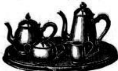
Nickel-Kaffee-Sortier von 9 A m.

wird allgemein als die schönste und reichhaltigste bezeichnet und bietet besonders in Spielwaren und Puppen, Galanterie- und Lederwaren, Luxus- und Bedarfsartikeln, Alfenide- und Nickelwaren, Kunstgusswaren und Bronzen zu den Preisen von 0.50, 1.—, 2.—, 3.—, 5.—, 10.— bis 50 Mark hervorragende Neuheiten.