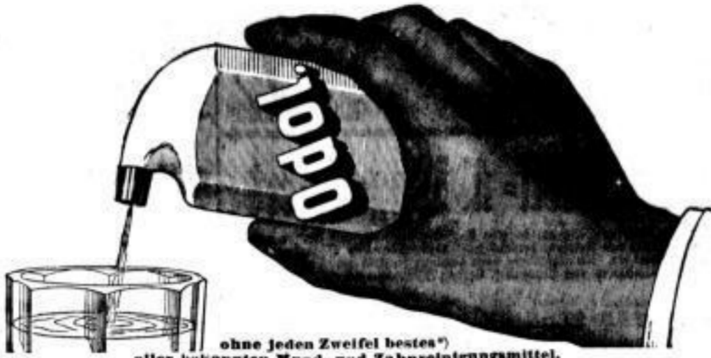
ohne jeden Zweifel bestes aller bekannten Mund- und Zahnreinigungsmittel.