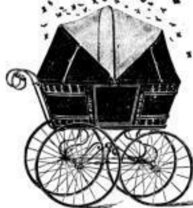
III Sicherheitsverdeck ganz geöffnet, Schutz gegen lästige Fliegen etc.

Das erste und einzige praktische Verdeck! Alleinverkauf: Baby-Bazar, E. Bruun, Neumarkt No. 7b. Erstes Specialgeschäft für sämtliche Baby-Bedarfs- und Luxus-Artikel.