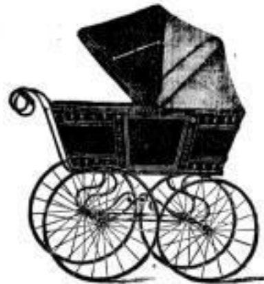
II Sicherheitsverdeck halb geöffnet, gestattet Durchzug frischer Luft.