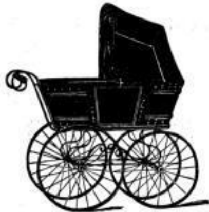
I Sicherheitsverdeck zusammengelegt, Schleier liegt unten.

sind von Aerzten empfohlen und die beliebtesten und vollkommensten .