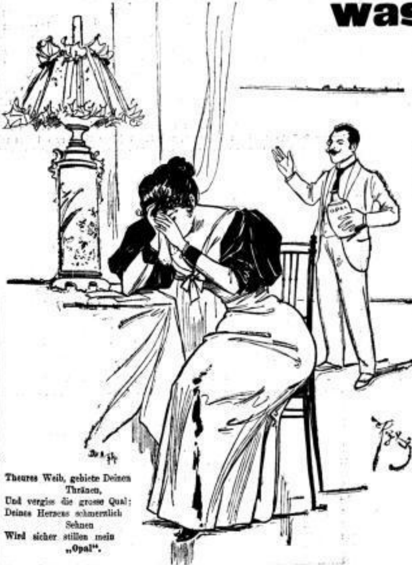
Thures Weib, gebiete Deinen Thränen, Und vergiss die grosse Qual; Deines Herzens schmerzlich Sehnen Wird sicher stillen mein „Opal“.

„Opal“ ist das neueste und beste Fleckenwasser der Welt!