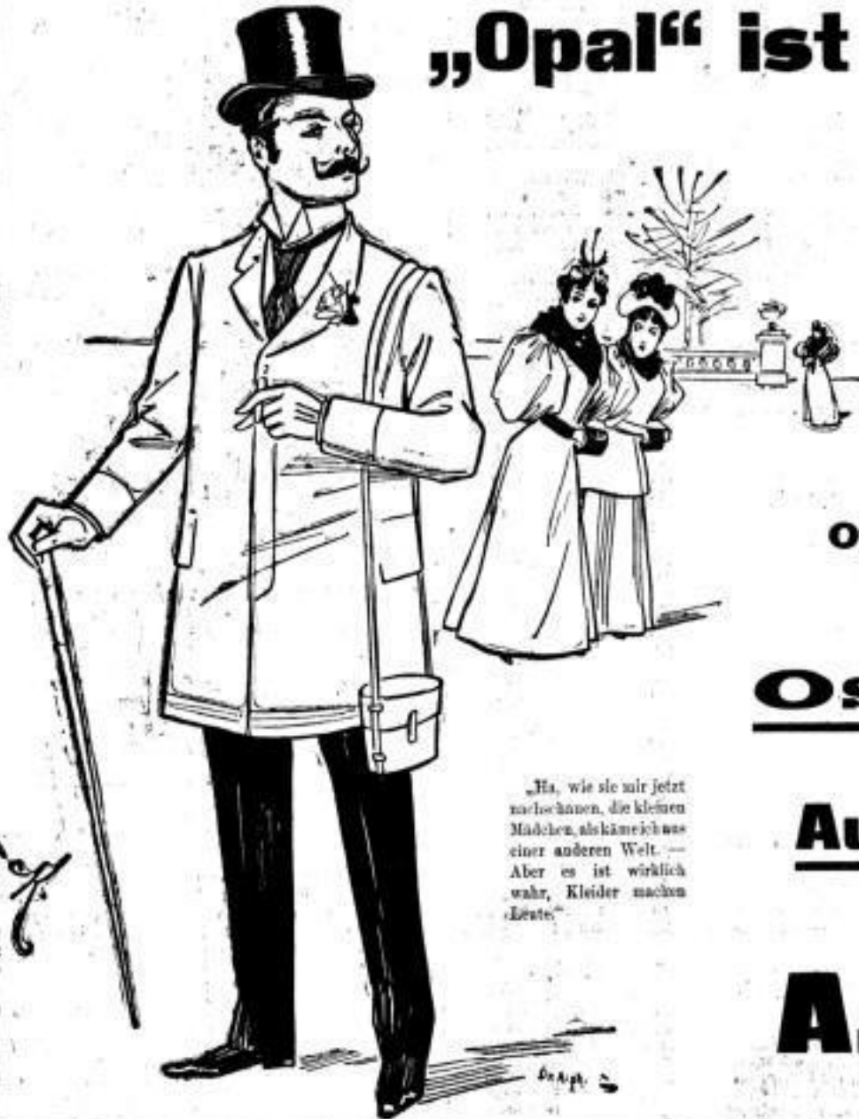
„Ja, wie sie mir jetzt nachsehen, die kleinen Mädchen, als käme ich aus einer anderen Welt. — Aber es ist wirklich wahr, Kleider machen Leute.“

„Opal“ ist das neueste und beste Fleckenwasser der Welt!