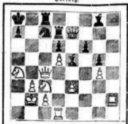
Zweiter. 48. ... T16-c8