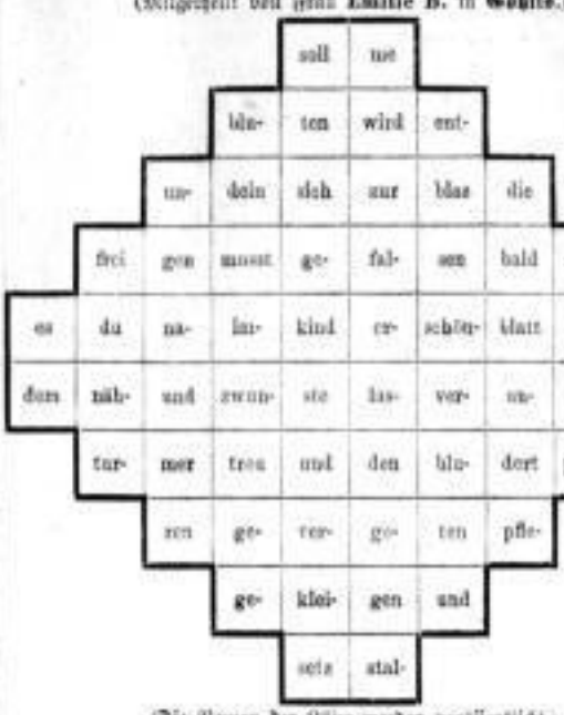
(Die Namen der Räufel werden veröffentlicht.)