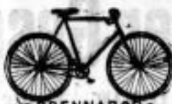
BRENNABOR ist der Name des