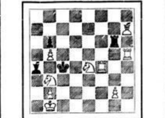
Weiße zieht an und legt in drei Zügen matt.