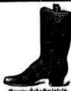
Herren-Schnürstiefeln Gummiarbeit dauerhaft 8.90 A