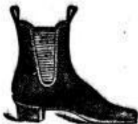
Herren-Stiefeletten Gummiarbeit ohne Brag 4.50 A