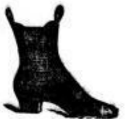
Damen-Leder-Stiefeln nicht pullig u. hoch 4.80 A