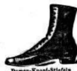
Damen-Knopf-Stiefeln eleganter engl. Schnitt 6 A