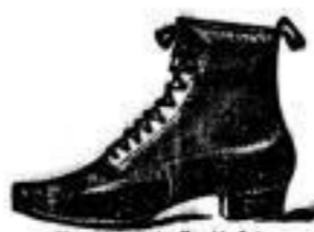
Herren-Schnürstiefeln in eleganter Form 7.50 A

elegant, mit schöner Schürze, mit englischen und hohen Absätzen, 2.35 A Herren-Zuch-Stiefeln 6.- A Damen-Zuch-Stiefeln 3.50 A Damen-Strapp-Schuhe 2.- A