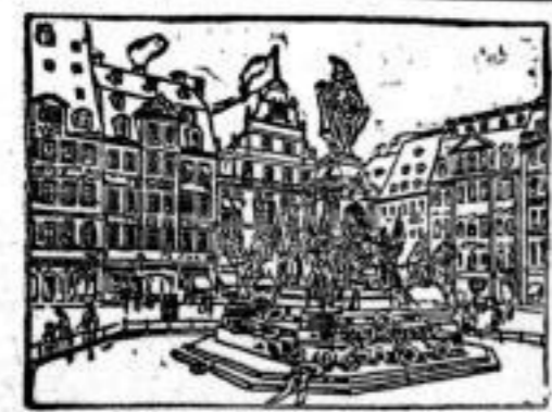
Soeben erschienen die mit Spannung erwarteten