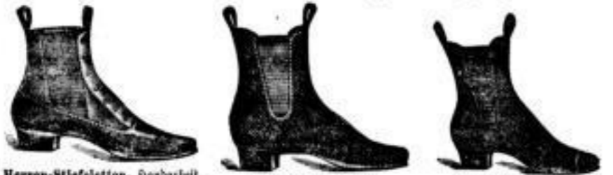
Herren-Stiefeletten, Damen-Stiefeletten, Herren-Schuheletten, Damen-Schuheletten, Damen-Leder-Stiefeln, Herren-Schuheletten