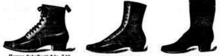
Herren-Schuheletten 7.50, Damen-Schuheletten 6.50 A, Damen-Knopf-Stiefeln, elegant, dauerhaft 6 A, Herren-Schuheletten, dauerhaft, dauerhaft, 6.90 A

Langstiefeln mit und ohne Fellen, 12 A, 13 A, 14 A