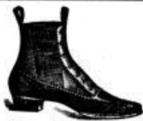
Herren-Stiefeletten, Gansarbeit, mit eleganter Knopfschmuckung, 5.90 A

Filiale: Leipzig, Reichsstrasse 33/35, I. Etage.