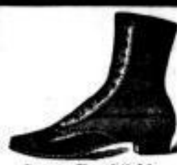
Damen-Knopfstiefeln, elegant engl. Schnitt, 6 A Prämenaden-Schuh für Damen 3.50 A, für Kinder von 1 A an.

Kinder 1.50, Damen 2.50, Herren 3.00 A Damen-Hauschuh 1.50 Damen-Strümpfen mit Led. 3.50 Damen-Landstiefeln 3.00 Walden-Knopfschuh 1.50