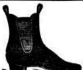
Herren-Stiefeletten Gansarbeit, ohne Brag, 4.50 A

Selt 36 Jahren bekannt durch gute Passform, grosse Haltbarkeit und Reellität.