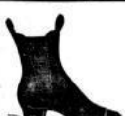
Damen-Leder-Stiefeln, Gansarbeit, 4.50 A

und Stiefel für Herren, Damen und Kinder.