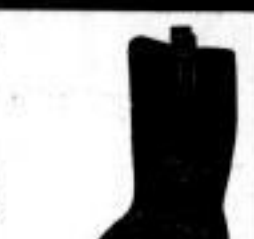
Herren-Schaftstiefeln, Gansarbeit, bauschelt, 5.90 A