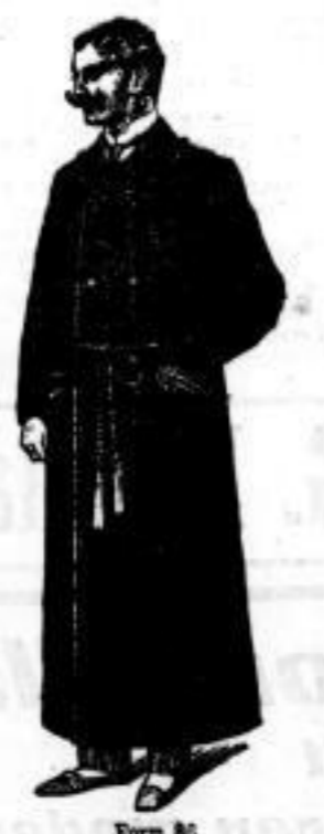
Schlafrock Mk. 20.—.