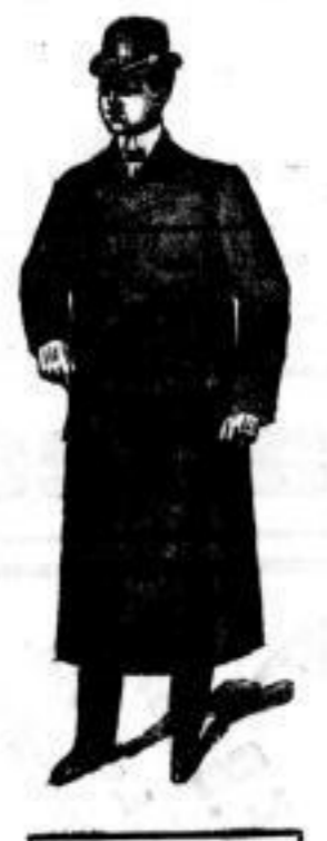
Winter-Paletot Mk. 45.—.

Grosses Sortiment in Schlafrocken in den Preislagen von Mk. 13.50 bis 65.— Winter-Paletots in den neuesten Formen und den solidesten Stoffen. Mk. 35.— bis 75.—.