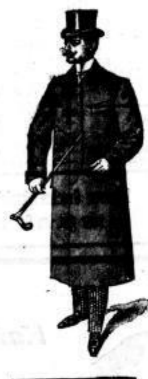
Winter-Paletot Mk. 35.—.

Herrn-Gravatten neuester Form Schleifen, Regattes, Plastrons und Selbstblinder. Special-Genres der Firma, Stück Mk. — 95, 1.25, 1.50, 2.—. Saloon-Neuhelt: Plastron Regatt mit Nadel. Herrn-Wäsche, nur eigene Anfertigung unter Leitung des Special- Zuschneiders, besonders empfehlenswerth. Universalhemd. Reform-Rockhemd.