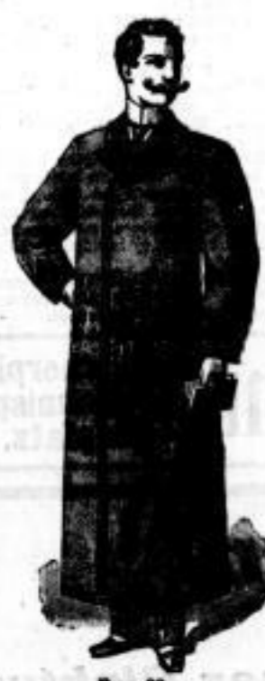
Schlafrock Mk. 17.50.