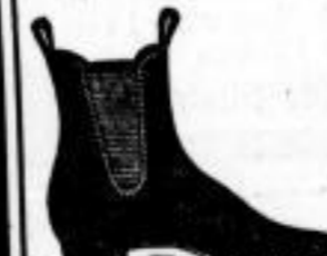
Herren-Stiefeletten, Zweifarbig, 4.50 Mk.