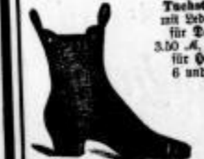
Tuchstiefeln mit Zwickel, für Damen 3.50 Mk., 4.50 Mk., für Herren 6 und 8 Mk.