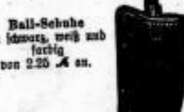
Ball-Schuhe in Leder, weiß und farbig von 2.25 Mk. an.