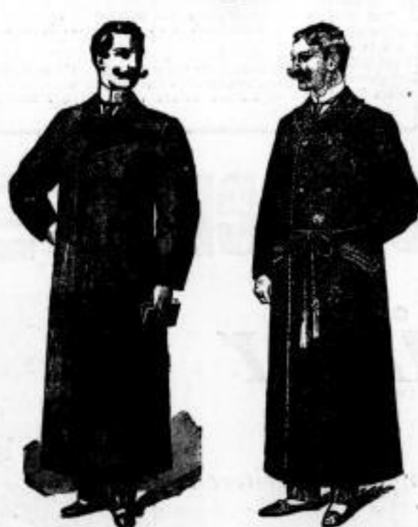
Form 90 Schlafrock Mk. 17.50. Form 86 Schlafrock Mk. 20.—