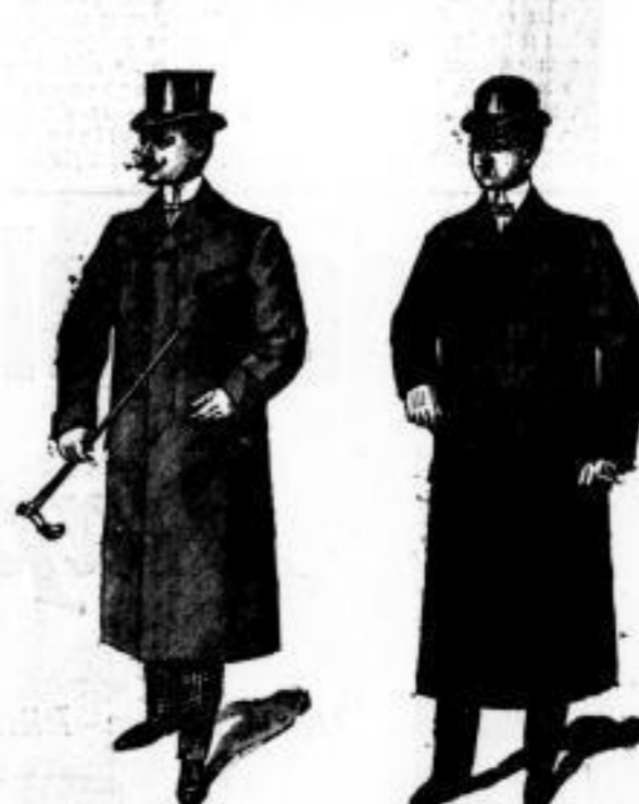
Winter-Paletot Mk. 35.— Winter-Paletot Mk. 45.—

Herren-Cravatten neuester Form Schleifen, Rezzattes, Plastrons und Selbstbinder. Special-Genres der Firma, Stück Mk. — 95, 1.25, 1.50, 2.— Saison-Neuheit: Plastron Regatt mit Nadel. Herren-Wäsche, nur eigene Anfertigung unter Leitung des Special-Zuschneiders, besonders empfehlenswerth. Universalmemd. Reform-Rockhemd.