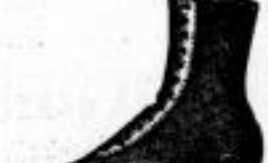
Damen-Knopf-Stiefeln, engl. Schnitt, 6 Mk.