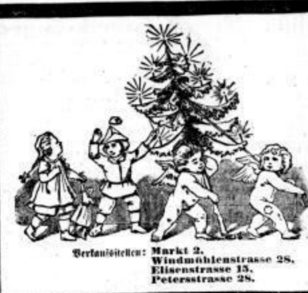
Verkauft bei: Markt 2, Windmühlengasse 28, Eisenstrasse 15, Petersstrasse 28.