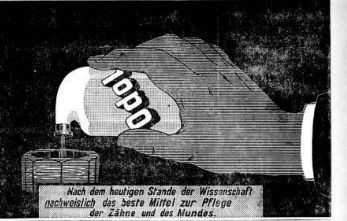
Nach dem heutigen Stande der Wissenschaft nachweislich das beste Mittel zur Pflege der Zähne und des Mundes.

Pianos, Flügel und Harmoniums Leinwand-, mittel. Colonialwaaren-Ge- schäft mit Weimars, 5. März im Centrum von Weimars, ist wegen Krankheit des Inhabers zu verkaufen. Erforderlich circa 25000 Mark. Offert. unter L. P. 967 an die Expedition dieses Blattes.