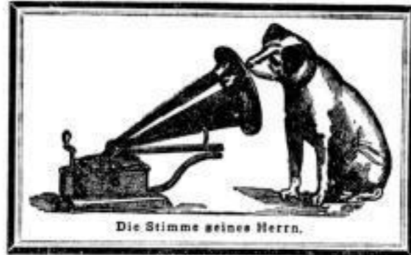
Die Stimme meines Herrn.