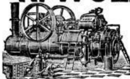
Ermittelter Kohlenverbrauch: 0,018 Ko. p. eff. Pferdekraft u. Stunde

Vorteilhafteste Betriebsmaschinen der Gegenwart.