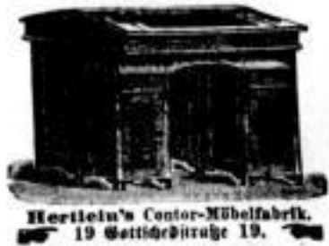
Hertlein's Cantor-Möbelfabrik, 19 Gottschdstraße 19.

Kontorpulte, Zettel, Kopierische, Waichtische sehr billig Gottschdstr. 19.