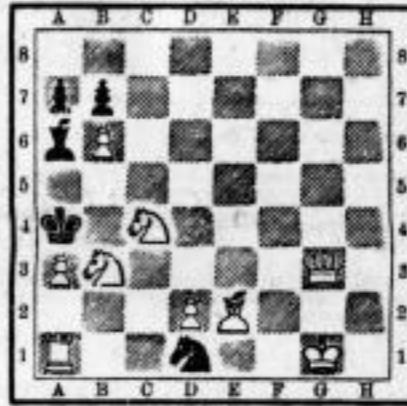
Welch sieht es und setzt in zwei Zügen matt (3 + 5 = 14).

Kuhgabe Nr. 1654. Von W. Pauly in Budapest.