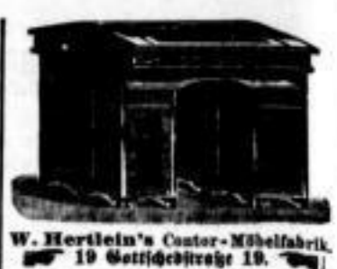
W. Hertlein's Cantor-Möbelfabrik, 19 Gottschewitzstr. 19.

Kontorpulte, Eßel, Copirtische, Waschtische sehr billig Gottschewitzstr. 19.