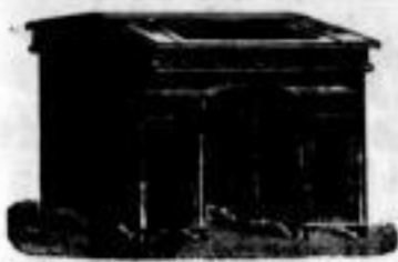
W. Hertlein's Contor-Möbelfabrik.

Contorpulte, Eßel, Copirtische, Waschtische