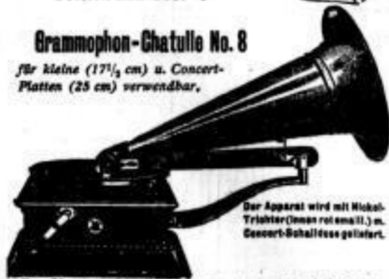
Grammophon-Chatulle No. 8 für kleine (17 1/2 cm) u. Concert-Platten (25 cm) verwendbar.

Der Apparat wird mit Nickel-Trichter (innen rot emaill.) u. Concert-Schalldose geliefert.