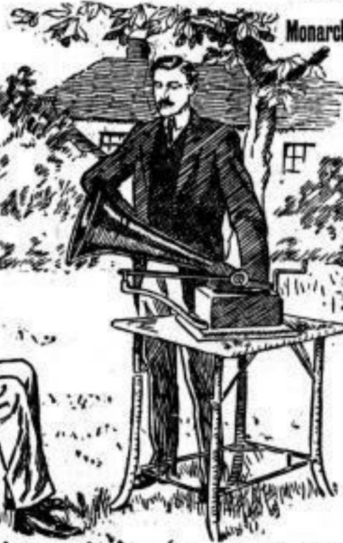
Monarch-Chatulle No. 11 mit Trompetenarm Gesetzlich geschützt.