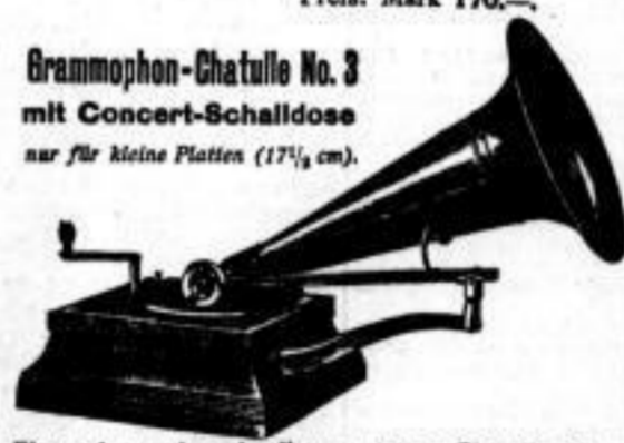
Grammophon-Chatulle No. 3 mit Concert-Schalldose nur für kleine Platten (17 1/2 cm).

Eine sehr geschmackvoll ausgestattete Chatulle mit Federlaufwerk. Das Holzgehäuse ist in eleganter geschweifter Form hergestellt und mit Rundstäbchen verziert. Aufmachung in englisch Mahagoni mit feinpoliertem Nickeltrichter, innen rot emailliert.