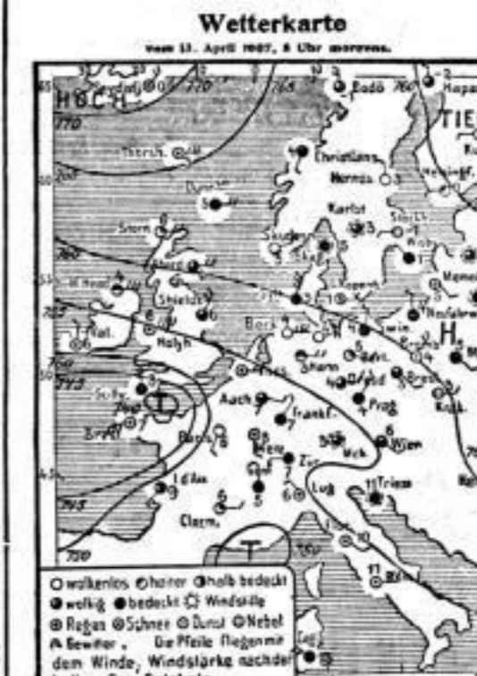
Wetterkarte vom 13. April 1907, 8 Uhr morgens.