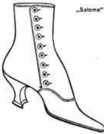
Das ist chic!

zu eleganten Frühjahrs-Toiletten und Trotteur-Costumen :