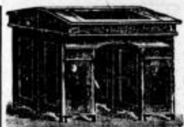
W. Hertleins Contor-Nübelfabrik.