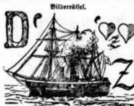
Bilderrästel. Lösung des Bilderrästel aus Nr. 441. Das Wasser hat keine Baifen.

Wöchten die Deutschen nie vergessen, was den Befreiungskampf notwendig gemacht und wodurch sie gelang.